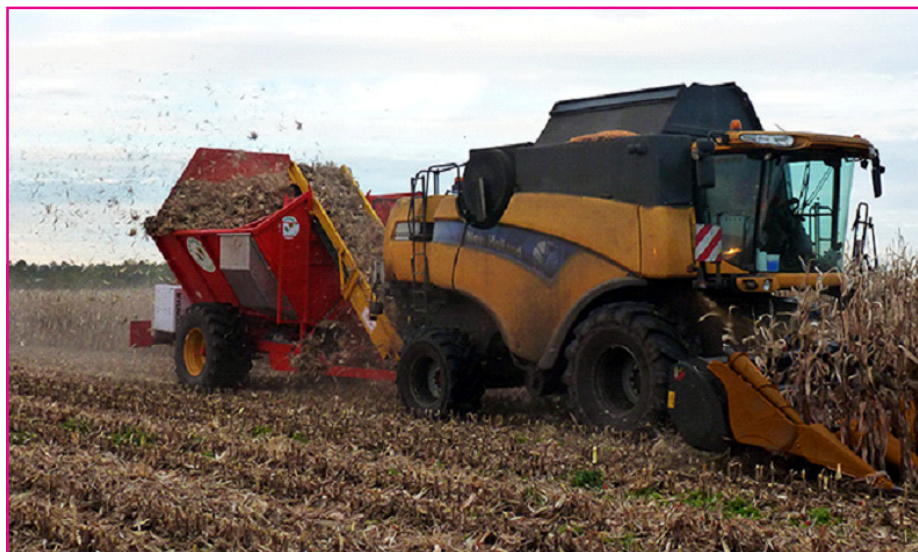
Рисунок 5. Зернозбиральний комбайн з підбирачем качанів COBS HARVESTER Lafargue Bio Energy.

На сьогоднішній день в умовах України можна реалізувати всі п'ять технологій заготівлі побічної продукції кукурудзи на зерно, але поки що однопрохідні системи – комбайн з прес-підбирачем – на вітчизняному ринку сільськогосподарської техніки не представлені, а підбирачі стрижнів і обгортки качанів для зернозбиральних комбайнів, мульчувачі та жатки з валкоутворювачами зустрічаються рідко. Разом із цим, у багатьох вітчизняних господарствах вже наявна сільськогосподарська техніка, яка дозволяє заготовити побічну продукцію кукурудзи на зерно за технологією №4 комбайн + трактор з мульчувачем + трактор з граблями + трактор з прес-підбирачем (таблиця 1). Визначимо витрати на заготівлю побічної продукції кукурудзи на зерно для цієї тех-