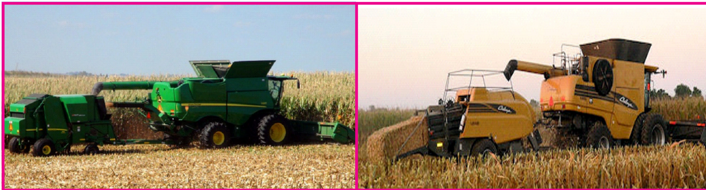
Рисунок 4. Однопрохідні система, де: а – Hillco для тюкування у рулони; б – AGCO Challenger для формування прямокутних тюків.

Для формування валків з кукурудзяної соломи застосовуються спеціальні жатки з валкоутворювачем у технології №2 (таблиця 1). У валках за сприятливої погоди побічна продукція кукурудзи на зерно може підсушитися, і таким чином покращаться паливні характеристики біомаси. Жатка Geringhoff Mais Star Collect може подрібнювати та розкидати стебла і листя кукурудзи або укласти їх у валок. Зверху на цей валок також можуть поступати подрібнені стрижні та обгортки качанів після молотарки комбайна. Компанія New Holland випускає пристосування для формування валків Cropower, що може бути приєднане до жаток для збирання кукурудзи. Це технічне рішення отримало срібну медаль на виставці Agritechnica 2013. Для збирання валків побічної продукції кукурудзи на зерно крім прес-підбирачів іноді застосовують кормозбиральні комбайни, і біомасу у подрібненому вигляді насипом транспортують до тваринницьких ферм або біогазових установок.