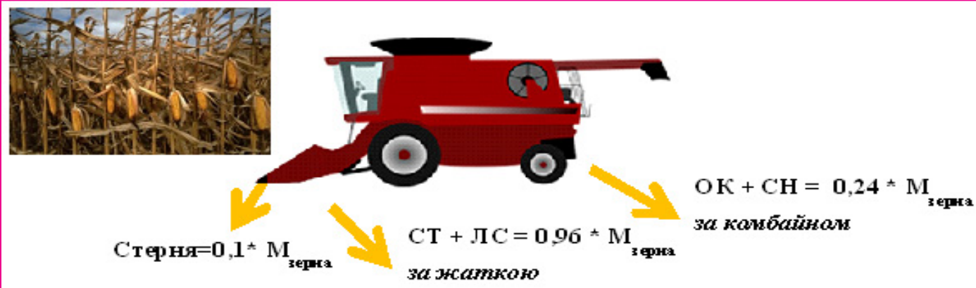
Рис. 1. Потіки та кількість утворення побічної продукції кукурудзи на зерно при використанні зернозбирального комбайна із кукурудзяною жаткою, де: СТ – стебла, ЛС – листя, ОК – обгортка качана, СН – стрижень, M_{\text{зерна}} – маса зерна.

даний спосіб економічно непривабливим. За рахунок використання комбінації базових технологій можна забезпечити збирання певної кількості біомаси, чого важко досягнути при заготівлі соломи зернових колосових, сої та ріпаку з огляду на те, що вся побічна продукція концентрується за комбайном. Перші чотири технології ущільнюють побічну продукцію у прямокутні тюки або круглі рулони, а п'ята – заготовляє її у подрібненому вигляді. Технологічні операції збирання, завантаження/розвантаження і перевезення розрізняються залежно від кінцевої товарної форми біомаси та, відповідно до цього, використовуються різні технічні засоби.