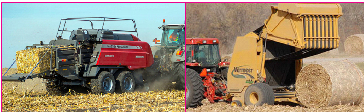
Рисунок 3. Обладнання для тюкування побічної продукції кукурудзи на зерно, де: а – прес-підбирач великогабаритних прямокутних тюків Massey Ferguson 2270XD; б – рулонний прес-підбирач 605 Super M Cornstalk Special Baler.