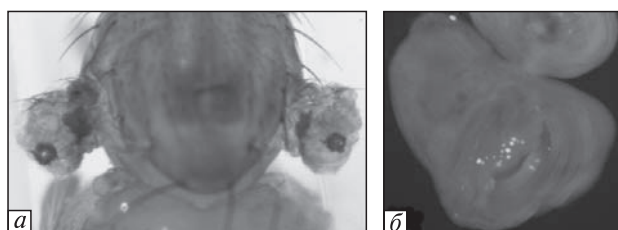
Рис. 1. Эктопические глаза у мух 1096-GAL4; UAS-ey на дорсальной и вентральной сторонах крыла (a) и две группы фоторецепторов, выявляемых антителами на Elav, соответствующих потенциальным клеткам эктопического глаза (б)

Результаты исследований. Эктопическая экспрессия гена ey в крыловом имагинальном дис-