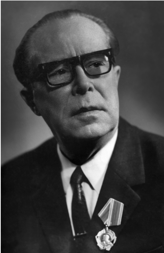
Андрій Якович Штогаренко.