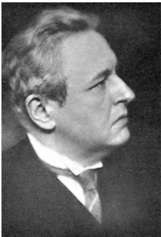
Фото 1. Йозеф Маркс (1882–1964). Фото 1932 року.

а також «провідною силою австрійської музики» 1 (Вільгельм Фуртвенглер), нині мало відомий навіть у себе на батьківщині. На пострадянському просторі ім'я і творчість композитора Йозефа Маркса – майже цілковита terra incognita .