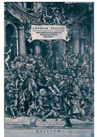
Фундаментальный труд Andreas Vesalius (1514-1564) Human corporis fabrica (1543 г.).

Andreas Vesalius — один из первых анатомов, изобразивших поджелудочную железу. Он смог блестяще нарисовать органы брюшной полости, точно определив расположение поджелудочной железы, хотя описана она не очень детально.