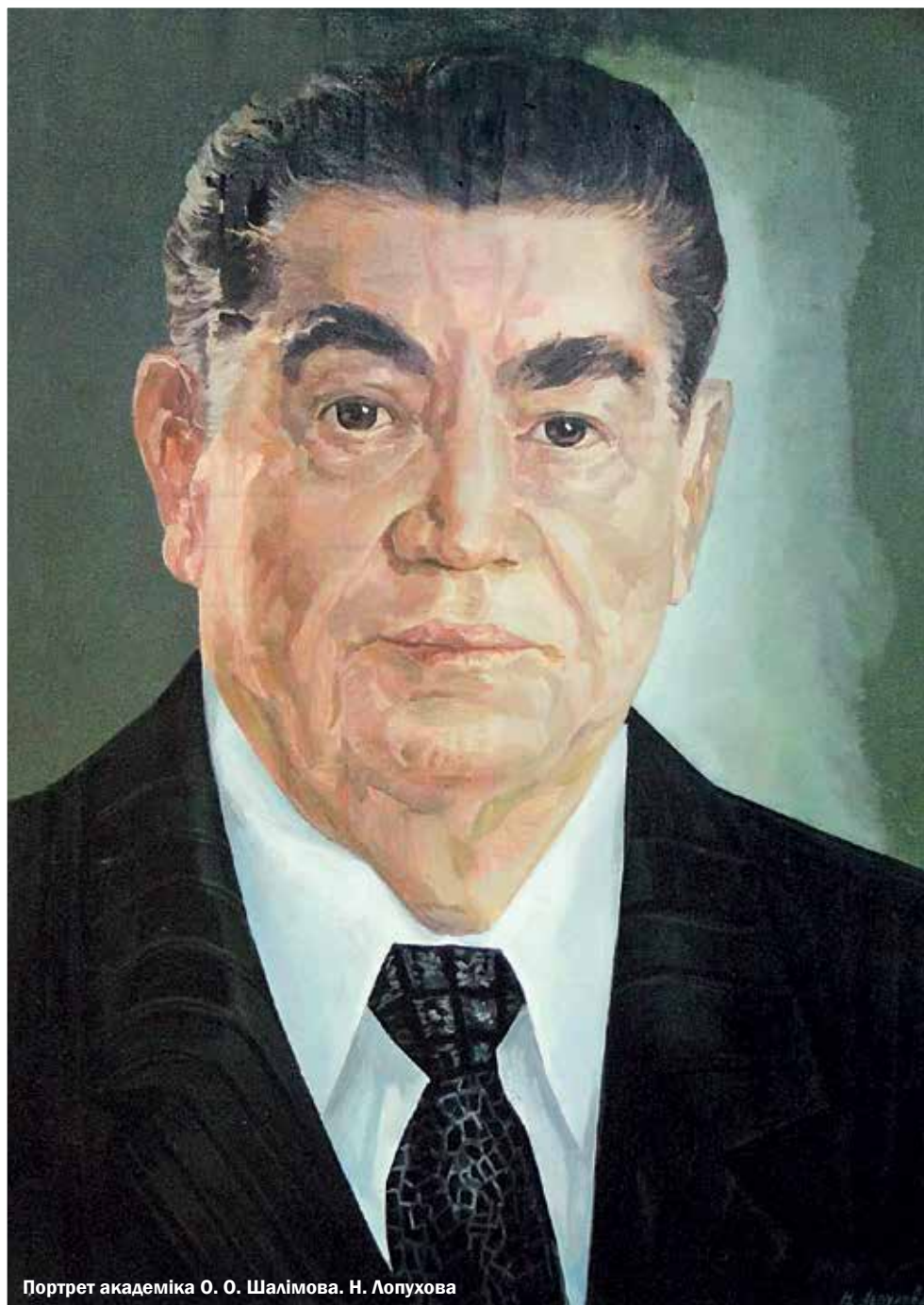
Портрет академіка О. О. Шалімова. Н. Лопухова

ГАСТРОЕНТЕРОЛОГІЧНИЙ ЖУРНАЛ • ISSN 2077-5067 • vkr.org.ua