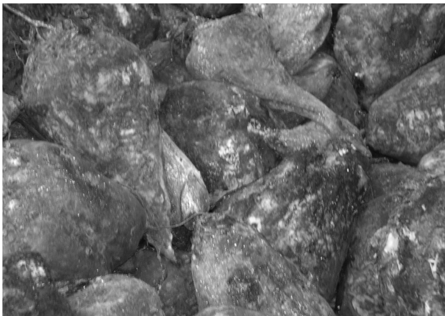
Рис. 2. Загнивання коренеплодів цукрових буряків у кагаті

В останні роки в посівах цукрових буряків все частіше проявляються грибні хвороби, тому звичайним стає раннє зараження (інфікування) коренів ґрунтовими мікроміцетами. Наприклад, нерідко у період прохолодної дощової погоди коренеплоди цукрових буряків інфікується грибом Pythium debaryanum , а за теплої вологої погоди – Aphanomyces sp. Проте рослини, уражені цими патогенами, при настанні сприятливих умов для свого розвитку, продовжують вегетувати хоча і з відставанням у формуванні маси коренів. Особливо це наочно проявляється при невдало-