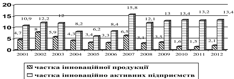
Рис. 2. Динаміка зміни частки інноваційної продукції та інноваційно активних підприємств на Львівщині

На рис. 2 наведено частку інноваційної продукції у загальному обсязі промислової продукції та частку інноваційно активних підприємств у загальній кількості промислових підприємств Львівщини.