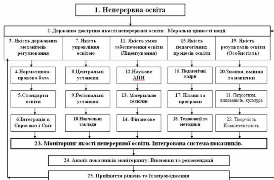
Рис. 2. Структурна та функціональна схеми державного управління якістю неперервної освіти в Україні

неперервною освітою; управління освітою; умов забезпечення освіти; педагогічних процесів освіти; результатів освіти) до відповідної системи фактичних показників з їх характеристиками та вимогами в неперервній освіті держави. В роботі досліджуються всі п'ять освітніх підсистем (рис. 2 – блоки 3,7,11,15 і 19) якості неперервної освіти держави.