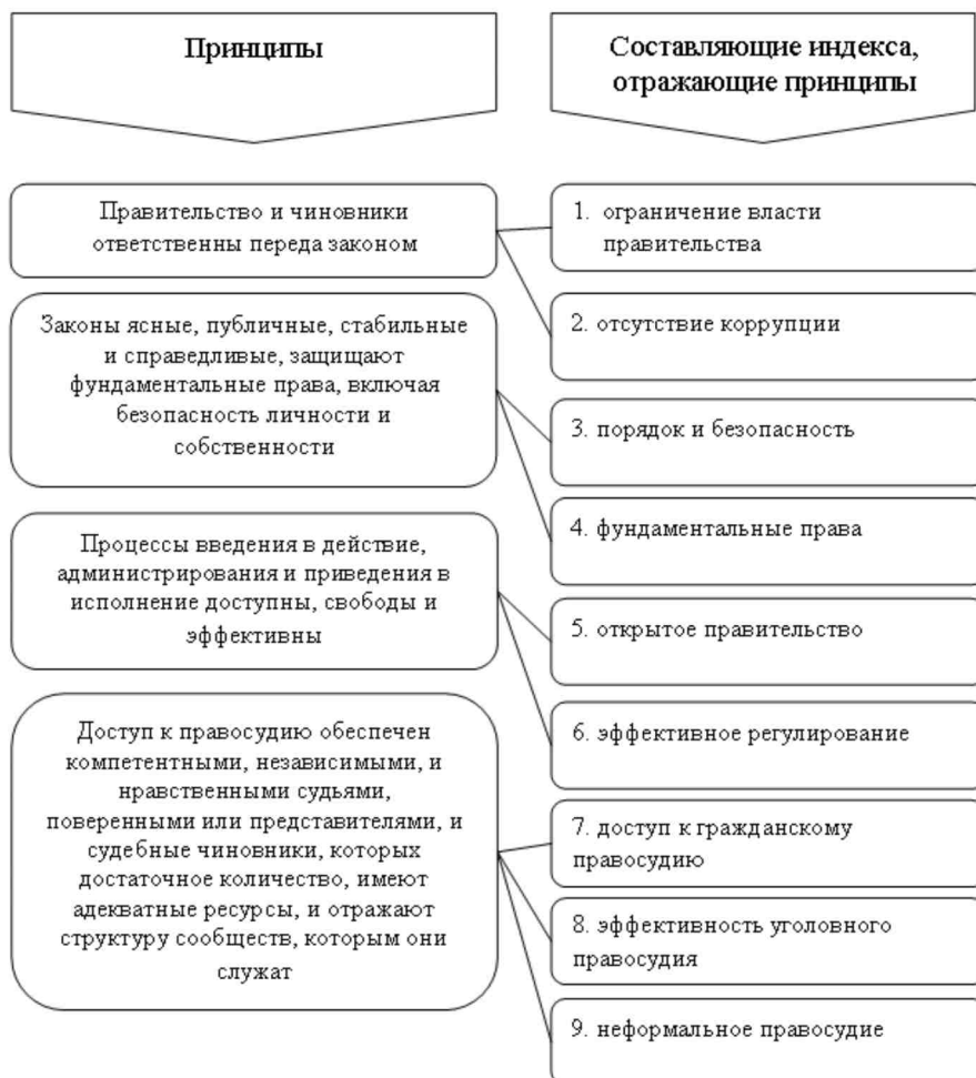
Рис. 1. Индекс верховенства права [4]

В настоящее время существует единственная международная система сравнительной оценки верховенства права, представленная Индексом верховенства права ( Rule of Law Index ), который включает следующие составляющие (рис. 1):