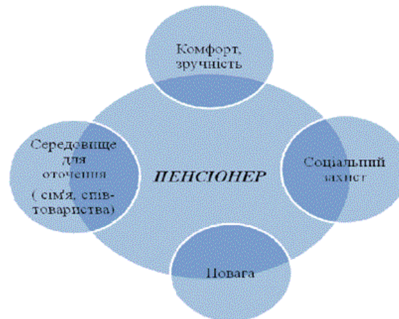
Рис.2. Модель розвитку міста для пенсіонера

На рис.2 представлена модель для пенсіонера. Головним напрямком цієї моделі є соціальний захист.