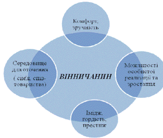
Рис.1. Модель розвитку міста відносно вінничанина

Опис деяких програм та порівняльний аналіз показав їх різноманітність та виявив потребу у чіткому виявленню цільової аудиторії та відповідності програм напрямками розвитку міста [3]. Як раз модель з орієнтацією на людину дозволить це зробити. На рис.1 представлена представлена така модель, що була запропонована робочою групою підготовки стратегічного плану розвитку м. Вінниця.