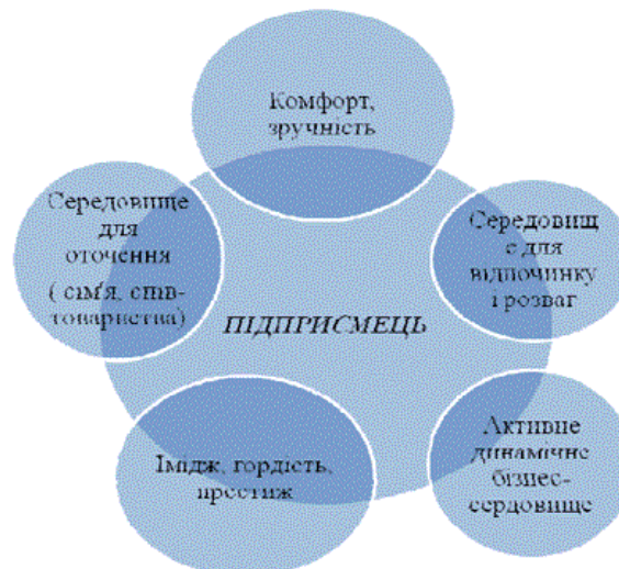
Рис.3. Модель розвитку для підприємця