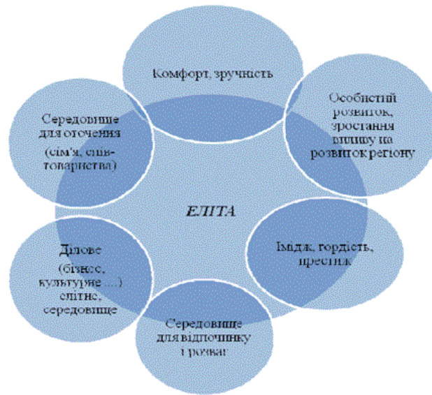
Рис. 6. Модель розвитку для елітного вінничанина

Реалізація цих моделей можлива тільки при умові організації ефективного менеджменту.