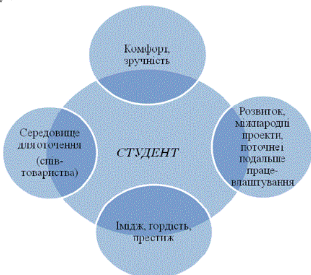
Рис. 5. Модель розвитку міста для студентської молоді

На рис.6 представлена модель елітного вінничанина. До нього ми відносимо свідомого вінничанина, якому важливо жити в нашому місті, розвиватись разом з ним. До еліти можна віднести багатьох представників міста. І орієнтація на них дозволить розвивати культурне середовище, бізнес-середовище, територію. Невелике елітне місто – це може стати додатковим гаслом для Вінниці. Разом з розвитком міста, розвивається і людина, і навпаки, розвиток окремих особистостей і суспільства в цілому впливає на розвиток території.