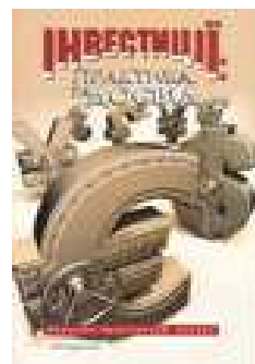
Журнал «Інвестиції: практика та досвід»