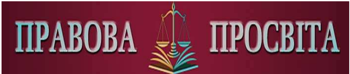
Електронне видання «Правова просвіта»