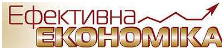
Електронне видання «Ефективна економіка»