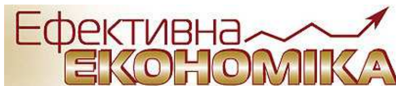
Електронне видання «Ефективна економіка»