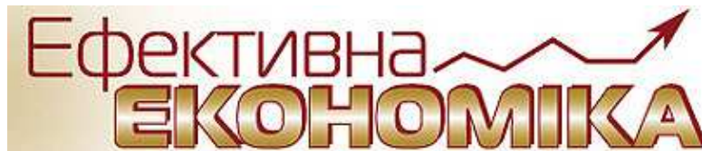
Електронне видання «Ефективна економіка»