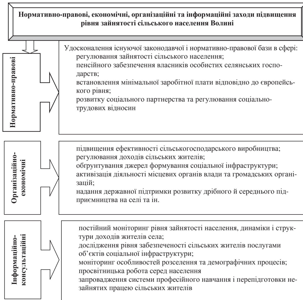
Рис. 2. Стратегічні заходи підвищення рівня зайнятості сільського населення Волинської області