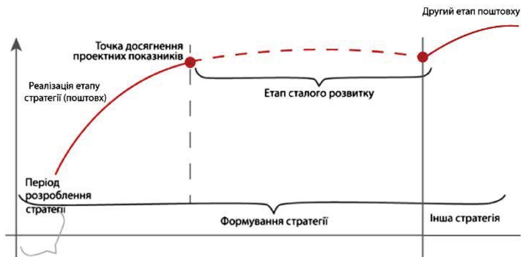
Рис. 1. Схема поетапного забезпечення сталого розвитку фермерських господарств

Розширене відтворення зазначених та інших процесів у фермерських господарствах можна забезпечити лише на основі інвестиційно-інноваційної моделі їхнього розвитку. Ця модель має забезпечити модернізацію господарств, яка є визначальною ознакою поштовху для розвитку (рис. 1).