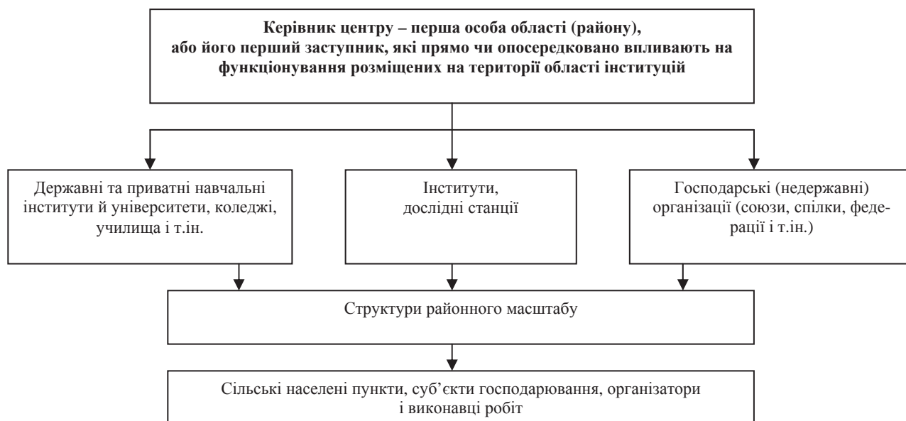
Рис. 1. Організаційна структура наукових (економічних) центрів розвитку сільських територій

Розв'язання проблеми організації запропонованих центрів і заходів впливає з необхідності переведення результатів наукових досліджень у практичну площину, а також створення умов для залучення для цього наявного потенціалу регіональної освіти й науки, посилення координації (рис. 1).