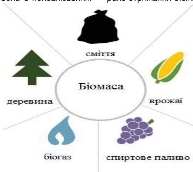
Рис. 1. Джерела отримання біомаси

джерелом енергії, адже містить збережену енергію від сонця та з використанням біотехнологій може бути перетворена на рідкі біологічні палива або біогаз. Основне джерело отримання біомаси наведено на рис. 1.