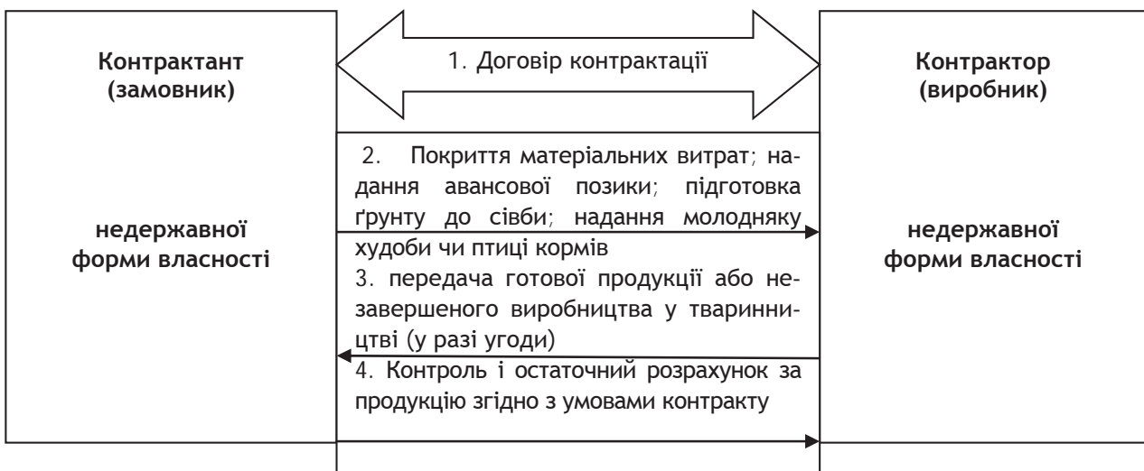
Рис. 2. Концептуальна схема простої виробничої контрактації суб'єктів недержавної форми власності в аграрному секторі економіки

За умов, коли контрактори і контрактанти мають недержавну форму власності, їхня взаємодія концептуально зводиться до чотирьох етапів: укладання договору виробничої контрактації, надання потрібних для виробництва продукції ресурсів контрактору, приймання-передача готової продукції до незавершеного виробництва та проведення контролю й остаточного розрахунку за укладеним контрактом (рис. 2).