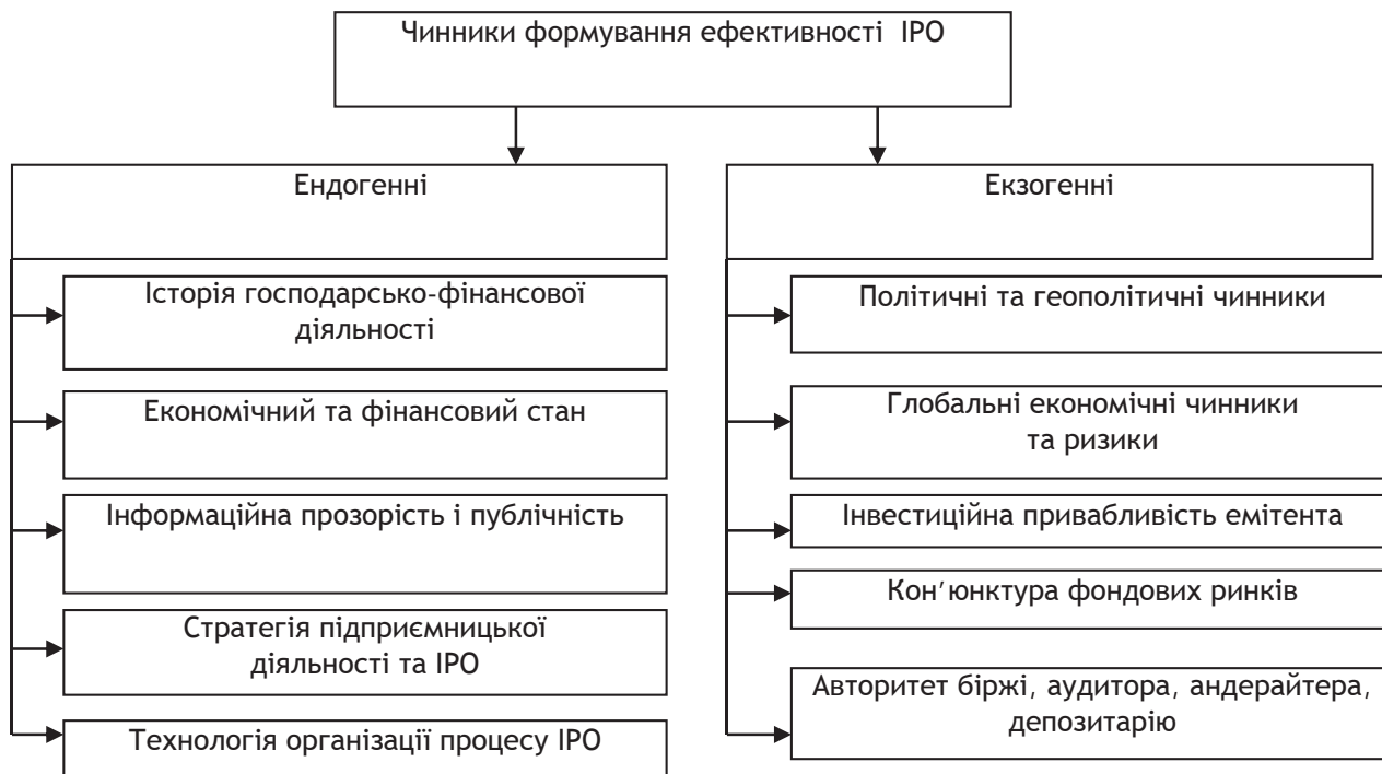
Рис. 3. Чинники формування ефективності діяльності інтегрованих суб'єктів господарювання на міжнародних ринках капіталів

На ефективність діяльності інтегрованих суб'єктів господарювання на міжнародних ринках капіталу впливає низка загальних і специфічних ендогенних і екзогенних чинників, що перебувають у тісному взаємозв'язку, визначаючи кінцевий результат (рис. 3).