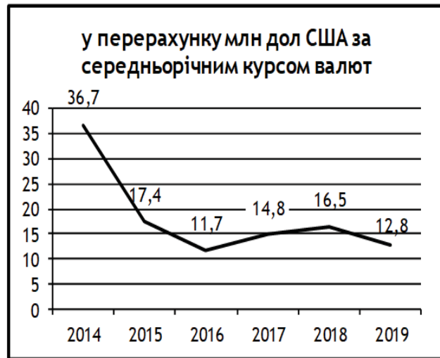
Рис. 2. Динаміка фінансування НААН за рахунок загального фонду Державного бюджету України, грн і дол. США, у перерахунку за середньорічним курсом валют