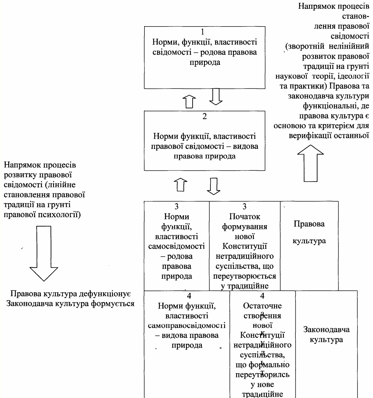
Рисунок 1 - Схема взємодетермінантного нетрадиційного, нормативно-регулятивного та ідейно-світоглядного становлення і розвитку української правової свідомості та культури

обласних центрах Східної України, що межують з Росією).