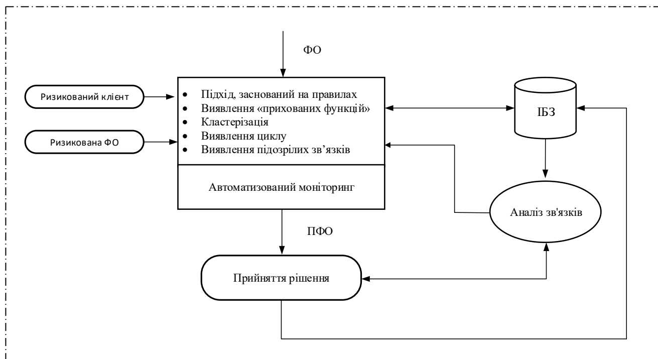
Рис.2 Блок-схема моніторингу ризику легалізації (відмивання) коштів, отриманих злочинних шляхом

Така система відповідає за моніторинг та виявлення будь-якої транзакції, яка може порушити одне або більше встановлених правил, чи зафіксувати певну підозрілу поведінку, виявлену в інших законних операціях. Крім того, він дозволяє «придбати» ризикованого клієнта для кожної фінансової операції (ФО) та ризиковану ФО для підозрюваної транзакції. Алгоритм моніторингу можна пояснити таким чином: