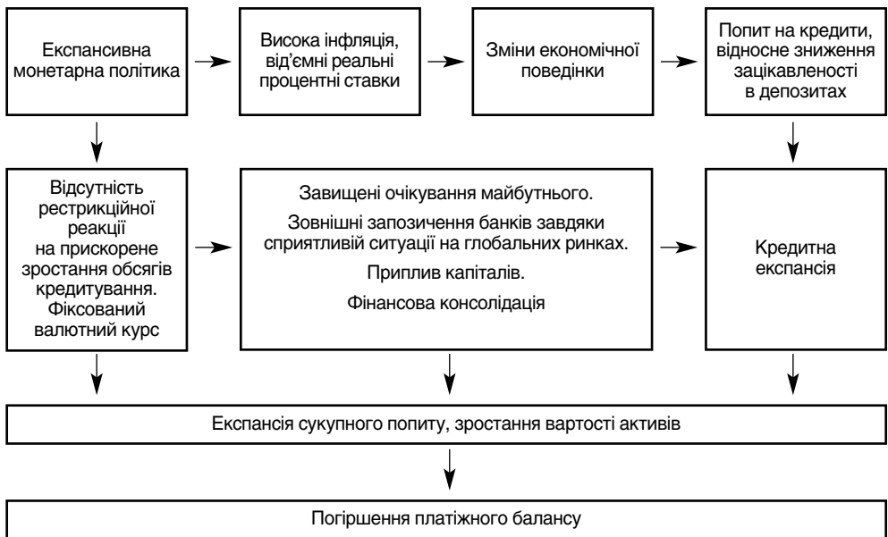
Рис. 2. Монетарні аспекти нагромадження макрофінансових дисбалансів вітчизняної економіки

поведінці. Обмеження даного аналізу сектором домогосподарств елімінує вплив інвестиційних міркувань на кредитну експансію і дозволяє побачити зміни в економічній поведінці населення.