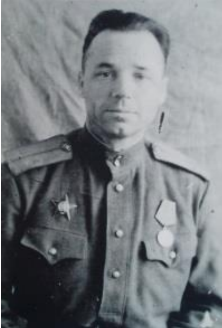
Рис. 1. Рубцов Леонід Іванович, 1946 р.

Постановка проблеми. Видатний дендролог та ландшафтний архітектор, паркознавець Леонід Іванович Рубцов (1902–1980) широко відомий унікальними проектами ділянок Національного ботанічного саду (НБС) імені