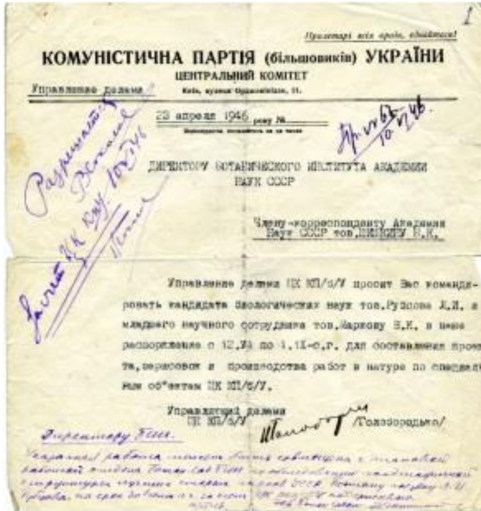
Рис. 2. Офіційний виклик Л.І. Рубцова та В.К. Маркової до м. Києва для роботи «по специальным объектам ЦК КП(б)У» (озеленення дачі М.С. Хрущова у Межигір'ї), 1946 р.

АН УРСР. Для відновлення будівництва Ботанічного саду, як самостійної установи АН УРСР, були необхідні кваліфіковані фахівці. Тому М.М. Гришко підбирав колектив співробітників для створення одного з кращих ботанічних садів світу [19, с. 10].