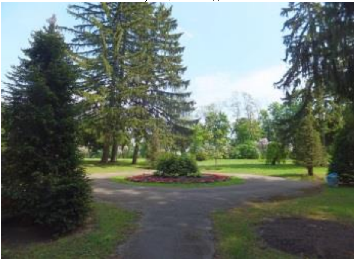
Рис. 4. Кругла клумба, від якої променями відходять доріжки, Межигір'я, 2018 р.

З півночі ділянку обмежують 15 кущів кизилу, висаджених над підпірною стіною у два ряди в шаховому порядку. Рослини віком 70–80 років досі рясно плодоносять (рис. 6). Рослини висаджені досить щільно 1×1 м. Наразі вони у гарному стані. Кизил міг бути висаджений з організацією на ділянці плодового саду у 1946 р. Можна також зробити припущення, що садивний матеріал могли завезти з приватного розсадника, а швидше усього – він місцевого походження – з колишнього монастирського саду. Поруч із сучасною каплицею, збудованою на місці одного з будинків, розміщений сад горіха волоського. З плодкових рослин збереглися також яблуні, айва звичайна. Ефектно виглядають дві щеплені на штаб рослини шовковиці білої плакучої форми. Прикрашають ділянку рослини магнолії Суланжа.