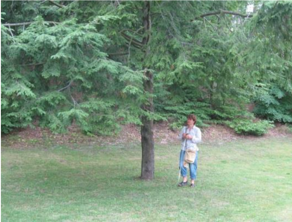
Рис. 7. О.П. Похильченко біля тсуги різнолистої, Межигір'я, 2018 р.