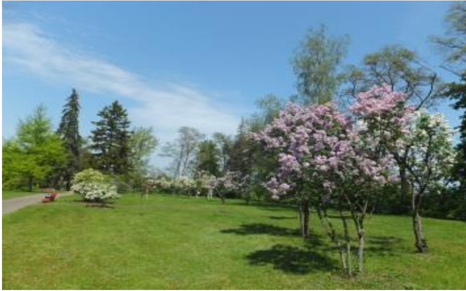
Рис. 5. Сад бузків в Межигір'ї