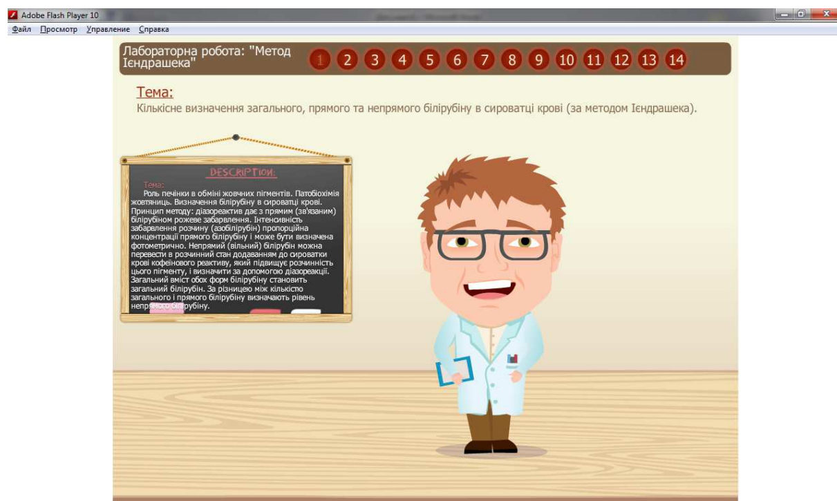
Рис. 1. Знімок екрану першої сторінки віртуальної лабораторної роботи «Кількісне визначення концентрації білірубіну у сироватці крові»

Інтерфейс інтерактивних лабораторних робіт був розроблений у вигляді двовимірної моделі навчального кабінету студента-медика і став комп'ютерним шаблоном для цілого циклу робіт з біологічної хімії. На рис. 1 і рис. 2, як приклад дизайну шаблону, наведені знімки екрану першої і четвертої сторінки (сцени) віртуальної лабораторної роботи «Кількісне визначення білірубіну в сироватці крові».