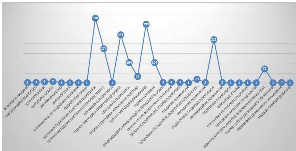
Рис. 2. Кількісний розподіл авторефератів дисертацій на здобуття наукового ступеня кандидата наук за науковими спеціальностями, представлених в РБД «Україніка наукова»

Компаративний аналіз кількості авторефератів дисертацій на здобуття наукового ступеня кандидата наук з питань загальної середньої освіти і виховання виявив такий кількісний розподіл за 32 спеціальностями [9], за якими відбувався захист (рис. 2).