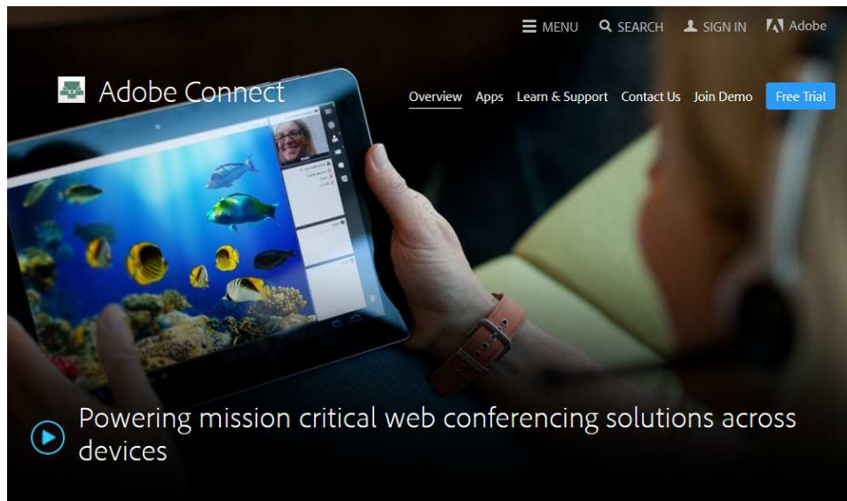
Рис. 2. Система організації веб-конференцій Adobe Connect Pro

релізі 9.0 внесена велика функціональність і гнучкість ліцензування, що робить продукт комерційно привабливим для використання текстових повідомлень і голосу через різні пристрої. Webex хмарна платформа надає послуги приватної хмари.