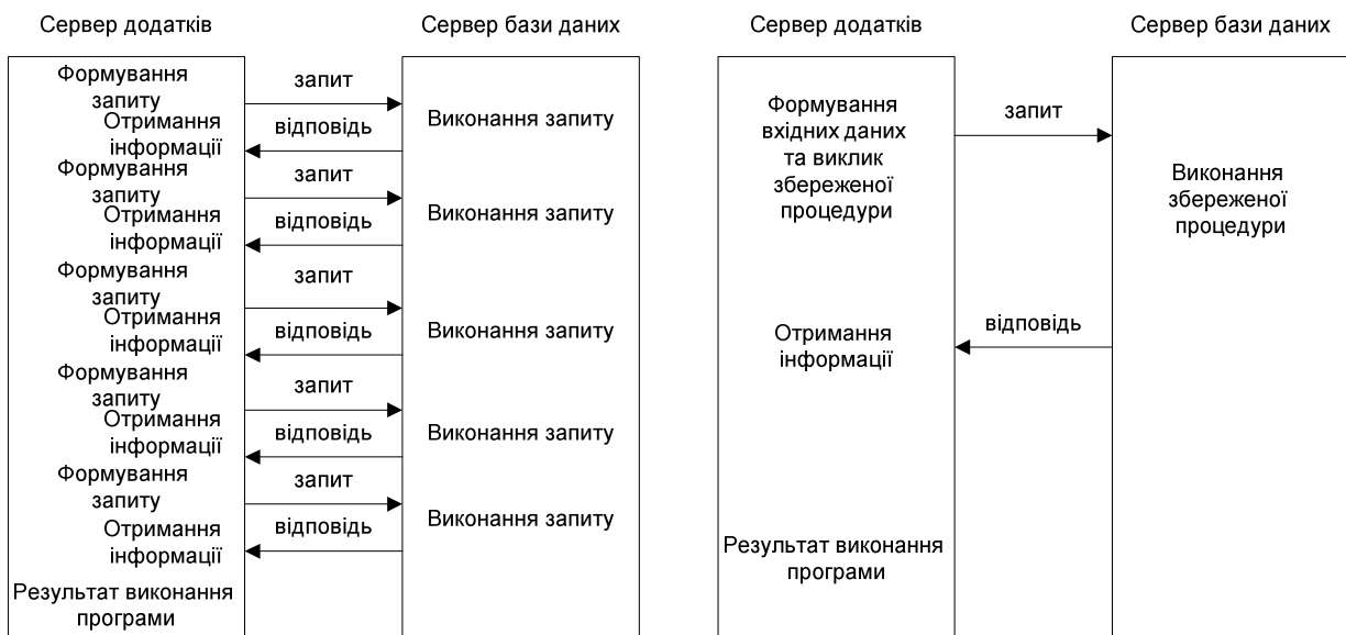
Рис. 1. Обмін інформацією між клієнтом та сервером бази даних в стандартному режимі та за допомогою збереженої процедури

Крім того, збережені процедури допомагають зосередити всі робочі алгоритми в одному місці. Без збережених процедур користувачеві довелося б вводити весь набір команд усякий раз, коли він хоче виконати якусь дію, а в даному випадку ви змінюєте збережену процедуру і ці зміни відразу ж стають доступні для всіх клієнтських програм, що використовують її (рис. 2).