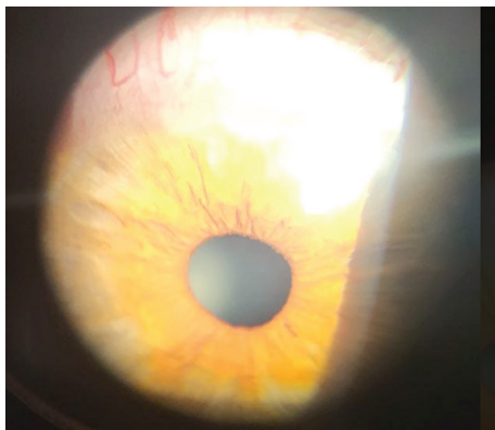
Фото 1. Локальне почервоніння епісклери та крайовий інтерстиційний кератит.

Призначено інстиляції фторхінолонів II покоління та сльозозамінників 4 рази на день в праве око. Через два дні в телефонному режимі пацієнт повідомив про повне зникнення симптомів захворювання. Йому було рекомендовано продовжити інстиляції фторхінолонів до 5 днів та сльозозамінників до двох тижнів.