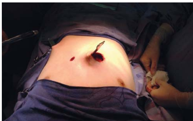
Рис. 2. Проведение корригирующей пластины