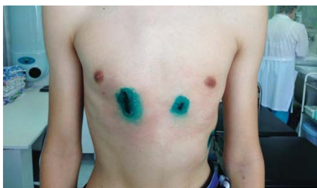
Рис. 4. Вид грудной клетки на 7-е послеоперационные сутки

За период 2008–2015 гг. в детском хирургическом отделении №1 ГБУЗ ТО ОКБ №2 г. Тюмени прооперировано восемь детей с КДГК. У шести проводилась торакопластика по Равичу. Операция заключалась в субперихондриальной резекции всех реберных хрящей с обеих сторон, начиная непосредственно со второго ребра, клиновидной поперечной и (или) косой стернотомии, укорочении реберных дуг. Такая операция травматична. Пациенты находились на стационарном лечении 18 \pm 3 дня, требовали длительного обезболивания и антибактериальной терапии, а после выписки – продолжительной иммобилизации.