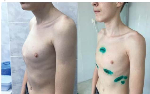
Рис. 5. Вид пациента Г. до операции и перед выпиской

Двум больным применена малоинвазивная торакопластика с использованием пластин из медицинской стали (завод медицинского оборудования, г. Тюмень). Учитывая небольшое количество наблюдений, проведение сравнения считаем некорректным. Поэтому положительные моменты данного способа лечения решили отразить в описании клинических наблюдений.