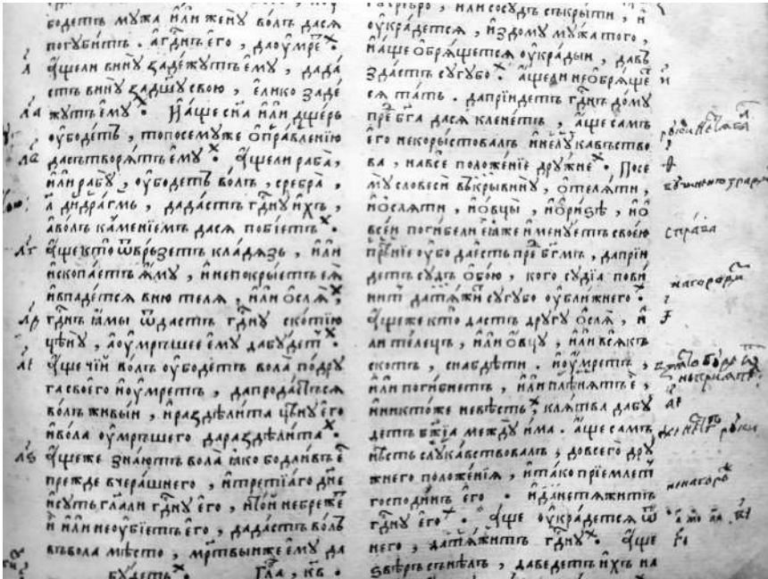
5. Острозька Біблія Кир.4476п, арк. 35 І рах., численні коментарі до Вих. 22.із записами Йоаники Сенотовича.