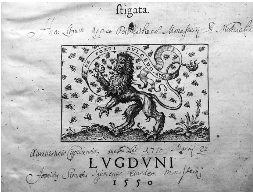
2. Фрагмент титулу Коментарів до кодексу Юстиніана Бартоло де Сассоферрато, (Ліон, 1550) із записом Йоанїкїя Сенютовича.