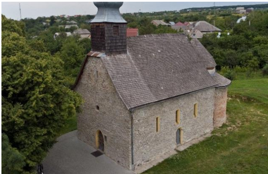
Рис. 2. Горянська ротонда

обрисовує деталі, зупиняючись однаково як на головному, так і на дрібницях. У «Розп'ятті» особливо вражає знепритомніла Марія, з омертвіло обвислими руками. Персонажі «Розп'яття» і «Покрови» відзначаються внутрішньою, майже фанатичною зосередженістю, в них відсутній м'який ліризм, який так підкупає в ранніх розписах Горянської ротонди.