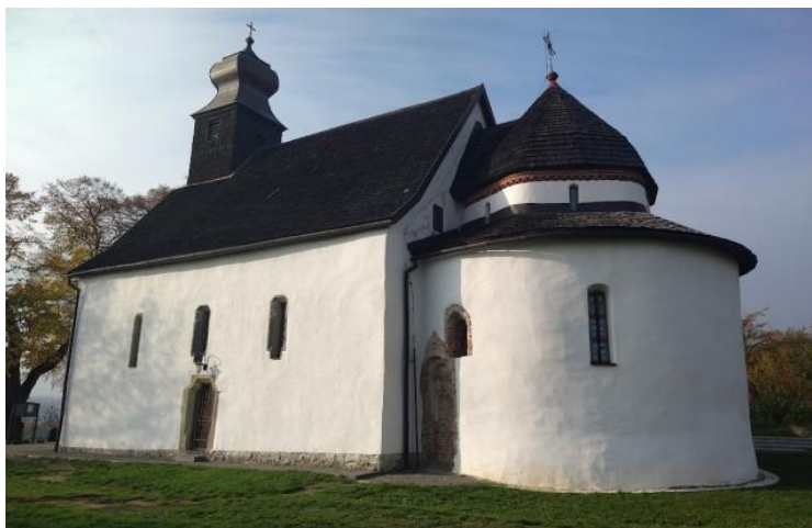
Рис. 1. Горянська ротонда (церква Святої Анни)

В Україні, зокрема в Горянах, вперше зустрічаємося з сюжетом «Дари волхвів» у тій трактовці, яка згодом твердо увійде в українське мистецтво. До Марії, яка невимушено сидить з дитиною на руках, підносять дари. Хлопчик з чисто дитячою безпосередністю одною ручкою ухопився за руку матері, а другу простягнув до дарів. Хоч одяг й зображений без світлотіньової ліпки, рисунок правдиво пов'язаний з позами, з поворотами і жестами фігур. Загальний колорит фресок, завдяки тонкій гармонії білих, вохристо-рожевих, золотистих, сіро-зелених та сіро-синіх Тонів, напрочуд гарний.