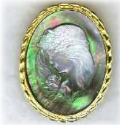
Фото 4. Гема, виготовлена за допомогою УЗ-верстата

Після проведення операцій порівняння цінності за визначеними показниками експерт вивчає ціни, зазначені в каталогах, стартові ціни на вітчизняних та закордонних аукціонах, досліджує пропозиції Інтернет-магазинів та фактичні ціни угод, які відбулися на ринку гем. Після визначення місця гема в ряді подібних експерт коригує отримані ціни та визначає вартість оцінюваної гема, зіставляючи з фактичними даними попередніх угод. Коригування цін угод слід проводити з урахуванням поправок на економічні показники та реалії українського ринку, а саме: комісійну винагороду посередника, інфляцію, поправку на кількість, ліквідність, корисність, прибутковість товару, соціально-економічну та політичну ситуацію в державі.