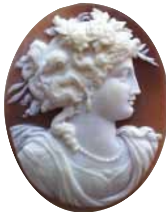
Фото 2. Мушлі Cassis Madascariensis (Sardonix) і геми, виготовлені з них