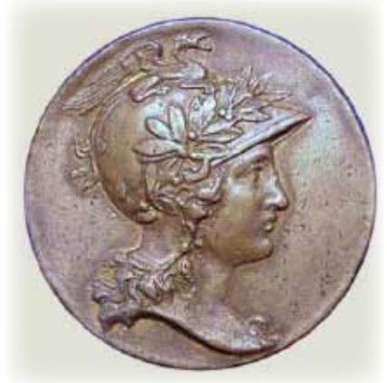
Фото 5. Скляна камея