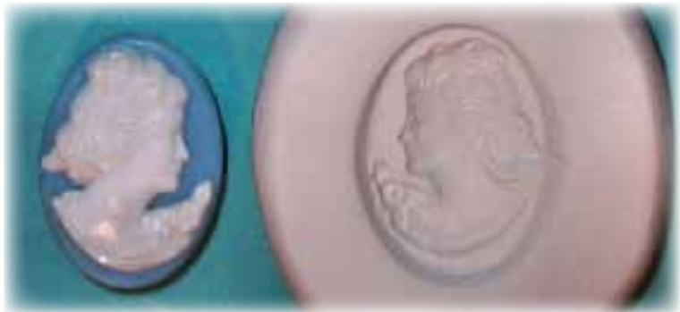
Фото 6. Формована камея