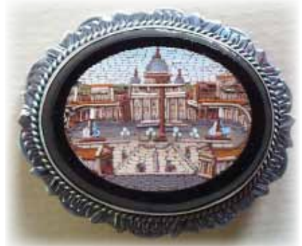
Фото 7. Камея, виготовлена у вигляді мікромозаїки