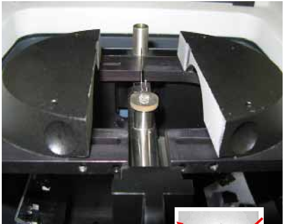
Рисунок 2. Приставка "Collector II" (на столику встановлено один з досліджуваних зразків)

Наявність хімічних зв'язків типу Al-O, Zr-O тощо зумовлює сильні коливання в кристалічній ґратці таких мінералів, як фіаніт, ІАГ, лейкосапфір, цим самим пояснюючи сильне поглинання в області 1700\text{--}400\text{ см}^{-1} . Слід зазначити, що ІЧ-спектри найбільш популярних імітацій досить часто дуже подібні, тому при ідентифікації останніх треба звертати увагу на область поглинання вище 1000\text{ см}^{-1} , а для деяких каменів вище 2000\text{ см}^{-1} . Найбільш характерні піки синтетичних замінників діаманту, що можуть бути також використані при діагностиці імітацій, показані на рисунку 4 (для кожної речовини