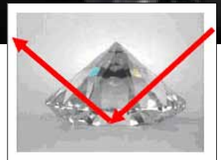
Рисунок 2а. Проходження ІЧ-променя через досліджуваний зразок