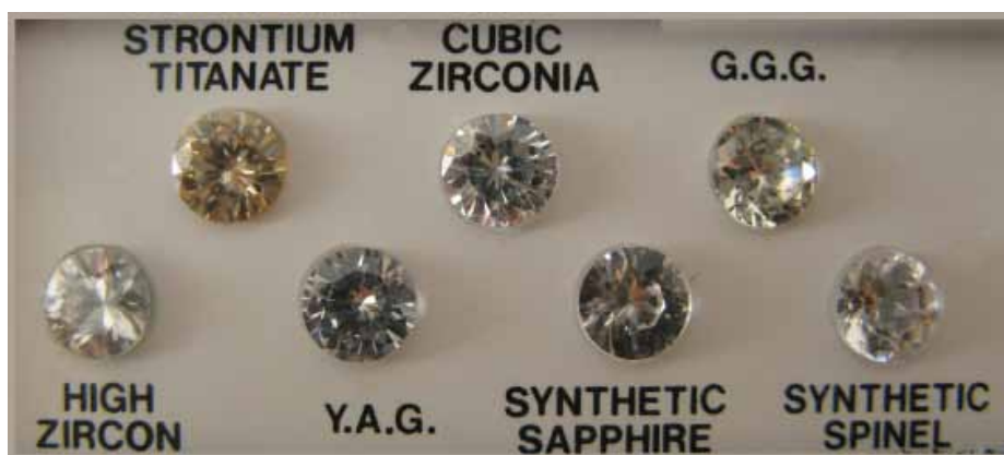
Рисунок 1. Зразки найбільш популярних імітацій

Отже, як бачимо, в ролі імітацій діамантів можуть використовуватися різні синтетичні камені, що, в свою чергу, передбачає різні способи їх ідентифікації (рис. 1). Наприклад, фіаніт, ітрій-алюмінієвий та галій-гадолінієвий гранати можна відрізнити від діамантів за густиною, яку визначають шляхом зважування на гідростатичних терезах або за допомогою важких рідин (у тому випадку, коли камінь знаходиться в незакріпленому стані). Іншими способами ідентифікації цих каменів, причому більш дієвими та надійними, є визначення їх теплопровідності, а в разі необхідності – віддзеркалювальної здатності. Для вимірювання цих показників ви-