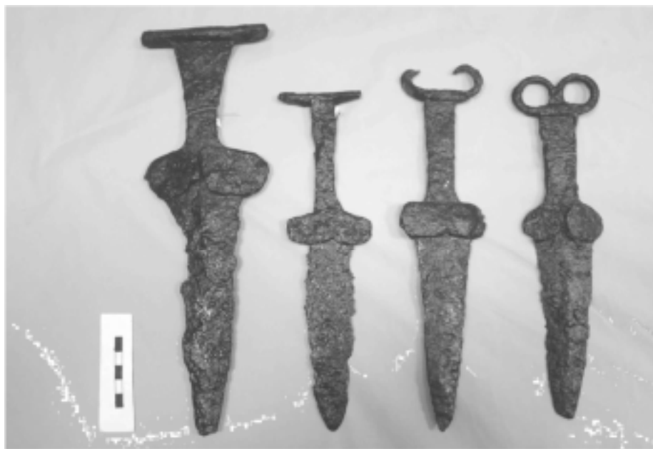
Рис. 1. Скіфські кинджали з Музею історії зброї

The publication introduces scientifically four Scythian daggers era Archaic, which are placed in the Museum of Weapon History in Zaporozhye.