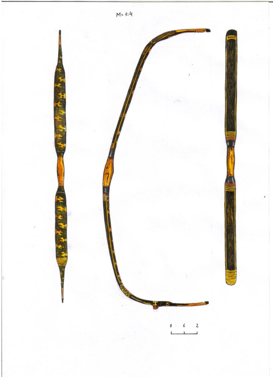
Рис. 9. Лук №1