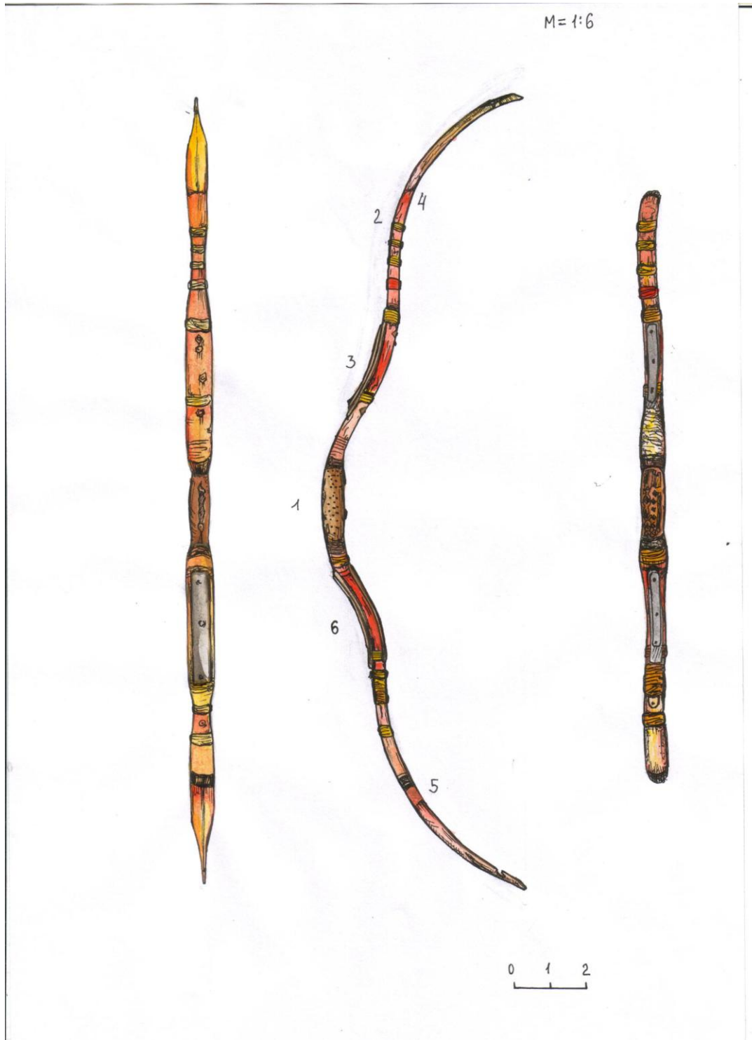
Рис. 11. Лук №3. Цифрами позначені орнаментовані ділянки кібіті