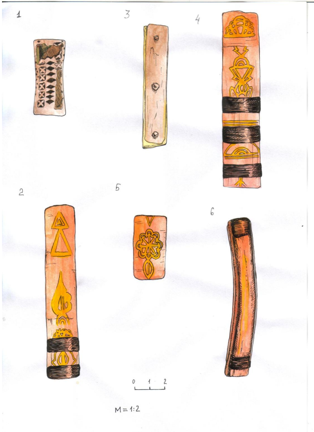
Рис. 12. Деталі декору лука №3