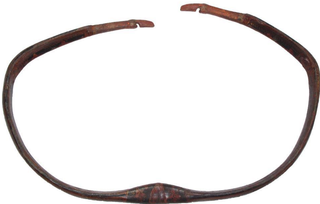
Рис. 13. Монгольський лук. Лот аукціону «Імперіал»