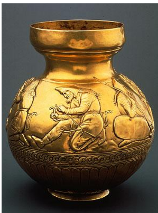
Рис. 5. Кубок з кургануКуль-Оба