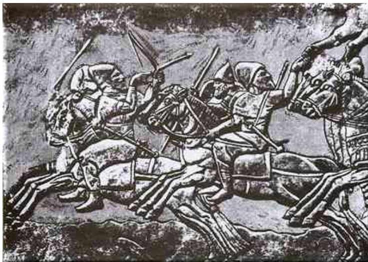
Рис. 2. Німрудський рельєф