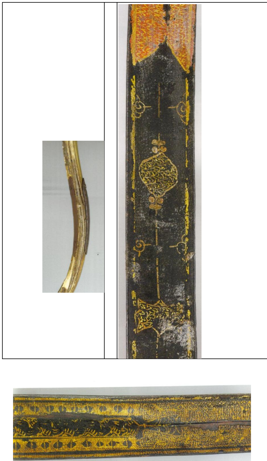
Рис. 14. Турецький лук. Експонат виставки у замку Фрідріхштайн