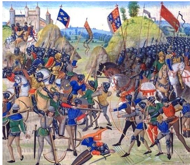
Рис. 7. Битва при Кресі. Середньовічна мініатюра