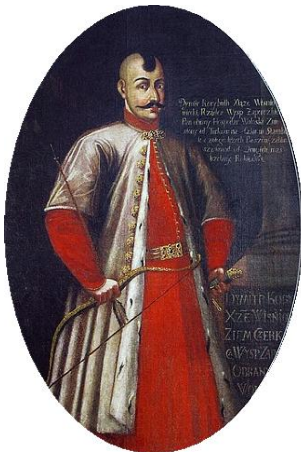
Рис. 8. Портрет легендарного Байди