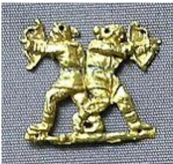
Рис. 4. Скіфські лучники. Золота платівка з кургануКуль-Оба