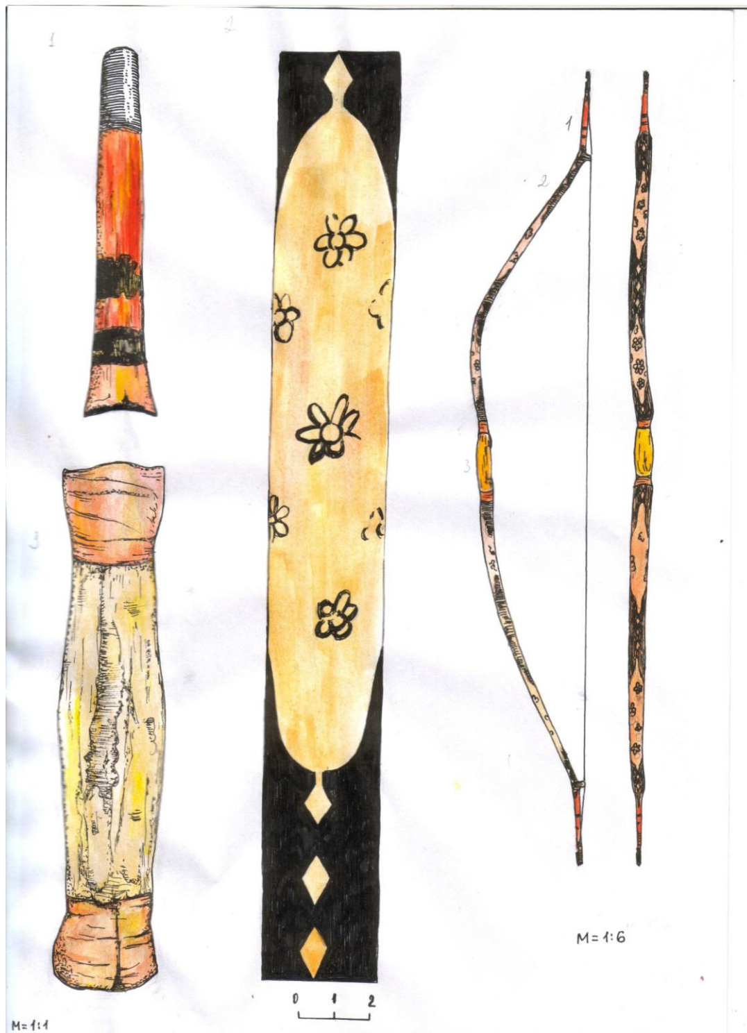
Рис. 10. Лук №2