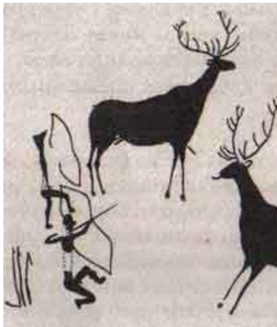
Рис. 1. Зображення мисливців з луками на петрогліфах (епоха мезоліту)

Two Mongol bows of XVIII century and one Turkish bow of XVII from the collection of the Museum of Weapons in Zaporozhye are first published in this article.