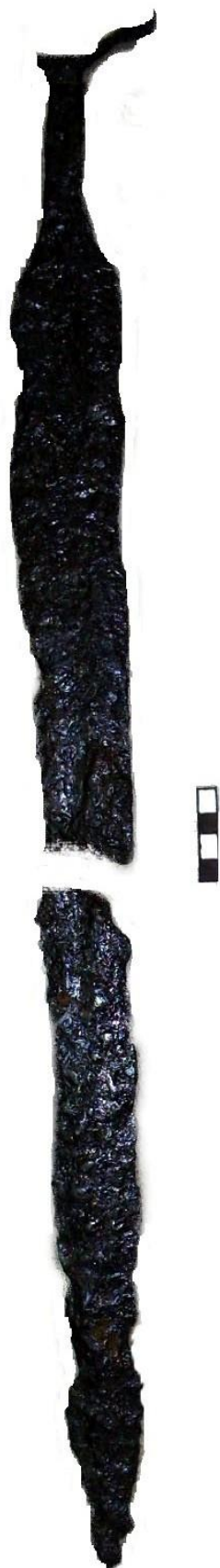
Рис. 2. Меч № 2