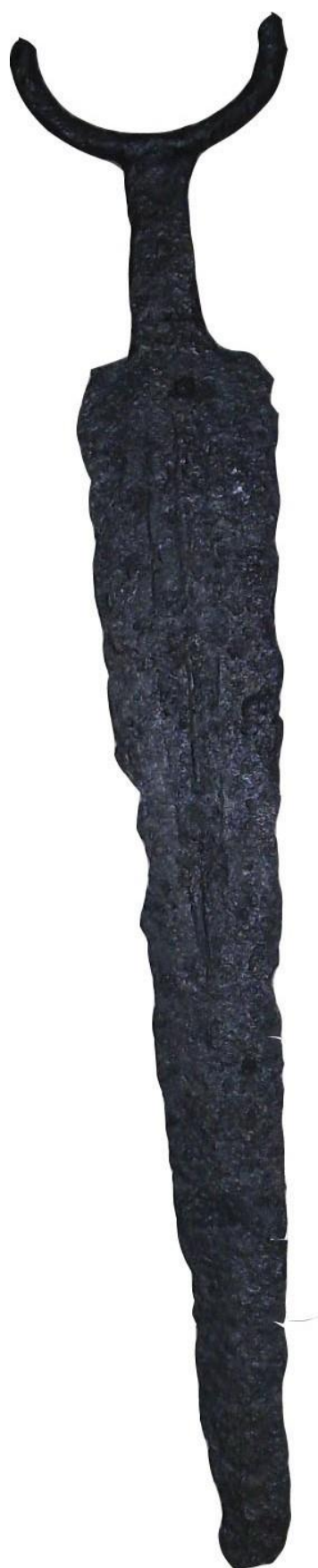
Рис. 4. Меч №3