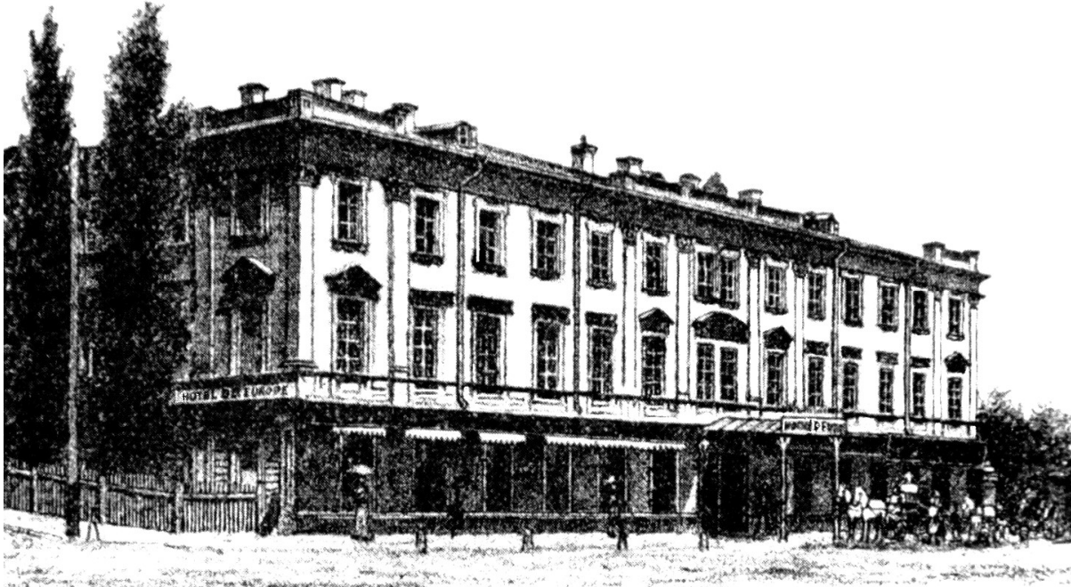
Іл. 5. Готель «Європейський». Арх. О.Беретті 1858р.

Знехтувати подібними доводами влада не могла і в серпні 1858 року було видано дозвіл на добудову, яка повністю завершилась до кінця року. Отже, до свого відкриття готель «підійшов» в такому вигляді: триповерхові, головний корпус по вулиці Хрещатик і бічне крило по вулиці Трьохсвятительській, та двоповерховий дворовий флігель служб. Фасади були витримані в стилістиці пізнього класицизму з мінімальним набором декоративних елементів коринфського ордеру, котрий було обрано для оформлення.