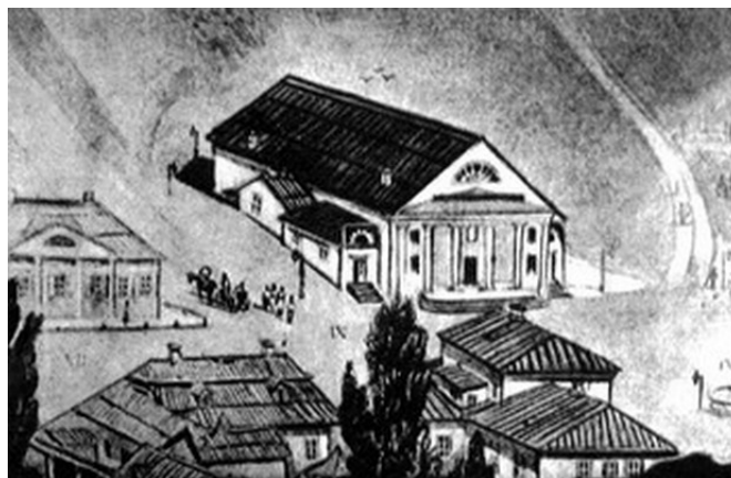
Іл.1. Перший міський дерев'яний театр Арх. Меленський 1805р.

перехрещувались дороги, що з'єднували усі три головні частини міста (Поділ, Печерськ та Старе місто). Хоча Хрещатик до самого кінця 40-х років ХІХ ст. залишався тихою, «провінційною» вулицею, будівництво театру стала знаковою подією для міста, а для самого Хрещатика виявилась воістину «містоутворюючим» об'єктом. Вперше на вулиці, де знаходились лише одноповерхові дерев'яні садиби, маленькі магазинчики та, аж єдина (!), двоповерхова кам'яна будівля, з'явилась культурна установа міського значення.