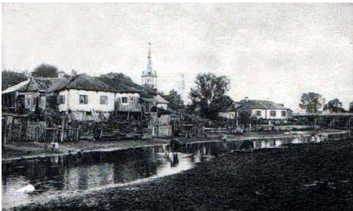
Рис.1 Природно-ландшафтне середовище локалізації міста Ковеля: вигляд з правобережжя на територію посаду (на передньому плані один з рукавів річки Турії та заболочена ділянка).

Отже, до ПЛФ, які мали вплив на заснування та подальший розвиток поселення віднесемо наступні: гідрографія (річка, її рукави, заболочені ділянки), рельєф (переважно з невисокими відмітками, рівнинний, без виражених природних доміант), рослинність (ліси, луки, рослинність заболоченої місцевості). Варто додати про існування такого штучного гідрографічного об'єкту як став – він був влаштований при підході до міста з півдня за допомогою насипної дамби. Тому формула природно-ландшафтного середовища локального характеру має наступний вигляд: «річка з розгалуженим руслом – став – рівнинний рельєф без виражених доміант - заболоченість» (рис.1).