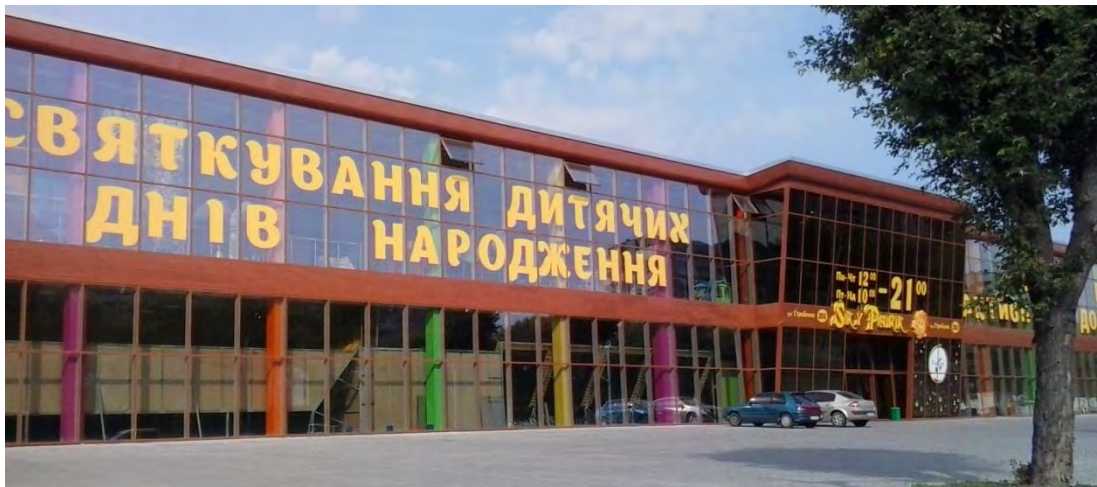
Рис. 2 Образне рішення споруди та фасадів дитячого розважального центру «Sky Park»

При візуальному огляді об'єкту дослідження було виявлено ряд переваг та недоліків, які впливають на перше враження про споруду. Суттєвим недоліком об'ємного вирішення споруди є те, що архітектура недостатньо виразна і з першого погляду нагадує торговий центр, офіс чи автосалон (рис. 2). Великі засклені не є характерними при оздобленні фасадів для дітей.