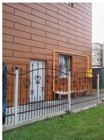
Рис. 3 а) Вирішення головного входу; б) боковий фасад зі сторони господарського подвір'я.

Об'ємно-просторовий аналіз показав, що будівля центру є адаптованою до кліматичних умов західного регіону: похилий дах, облицювальні матеріали, глухі фасади з північної та західної сторони. Взагальному об'ємно-композиційне рішення є достатньо продуманим в плані пропорцій. Архітектурі не вистачає цікавого силуету, яскравих елементів, які б робили споруду неповторною та підкреслювали її головну функцію.