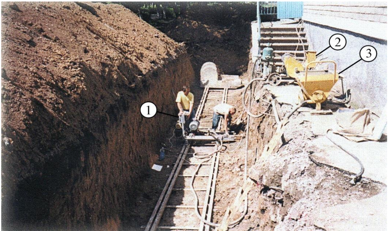
Рис. 3. Підсилення основи фундаментів горизонтальним армуванням ґрунтів після вирівнювання будівлі:

ховані зміни фізико-механічних характеристик і, як наслідок, в процесі експлуатації при аварійних замочуваннях основи фундаменти нерівномірно осіли і будинок нахилився, крен значно перевищив допустимі норми, в конструкціях з'явилися суттєві тріщини. Комісія визнала його аварійним, були виділені кошти і внаслідок виконаних відновлювальних заходів, шляхом вирівнювання нахилоного будинку і закріплення ґрунтів, по аналогії із вище описаними технологіями, будинок відновлений в проектне положення і тим самим забезпечена подальша надійна експлуатація. Від початку проектування і до здачі будинку в експлуатацію автори приймали безпосередню участь. На рис. 3 показаний фрагмент підсилення основи фундаментів після вирівнювання будівлі. Вирівнювання та підсилення основи виконуються в стиснених умовах малогабаритним устаткуванням.