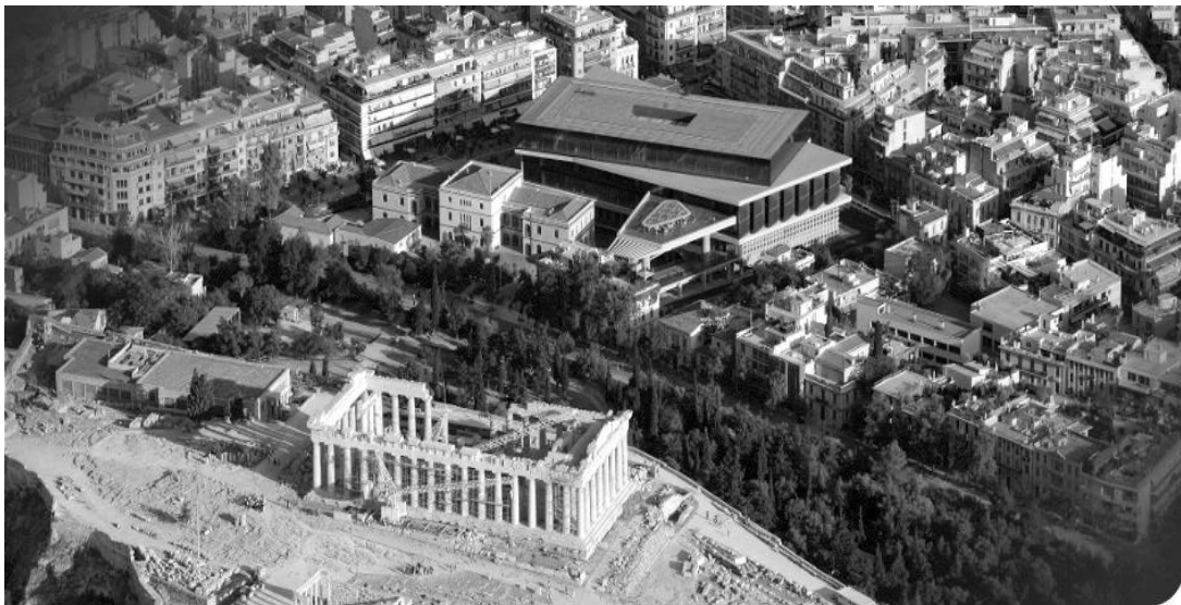
Рис. 3. Новий музей Акрополя в Афінах, Греція.

Комплекс споруд нового Музею Акрополя в Афінах було офіційно відкрито у червні 2009 року. Музей розташований в історичному районі «Макріянніс», за 300 м на південь від пагорбу Акрополя. Центральний вхід у Музей знаходиться на початку пішохідної вулиці Діонісія Ареопагіта і є головною віссю єдиної мережі експозиції археологічних місць Афін. Поблизу нього знаходиться Музей Центру вивчення Акрополя (XIX ст.) та станція метро «Акрополь». Архітектор Бернард Чумі у своєму вирішенні використовує просту і чітку геометрію форм з горизонтальними об'ємами, підпорядковуючись таким чином головній просторовій домінант – пагорбу Акрополю. Основний корпус музею поставлено на колони, що дозволяє експонувати і захистити від непогоди пам'ятки археології.