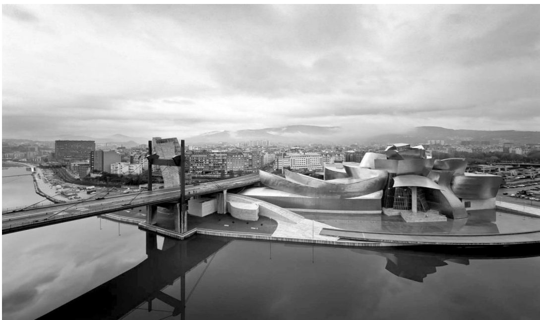
Рис. 1. Музей Гуггенхайма у Більбао, Іспанія.

Музей Гуггенхайма (The Guggenheim Museum Bilbao) у Більбао, Іспанія, було відкрито для відвідувачів у жовтні 1997 року. Розташоване на березі Біскайської затоки Більбао, четверте за величиною місто в Іспанії, один із найважливіших портів країни, а також промисловий, транспортний та торговий центр. Будівництво музею та формування культурного центру високого класу було частиною масштабної програми реконструкції міста, розпочатої у 1980-х роках [4].