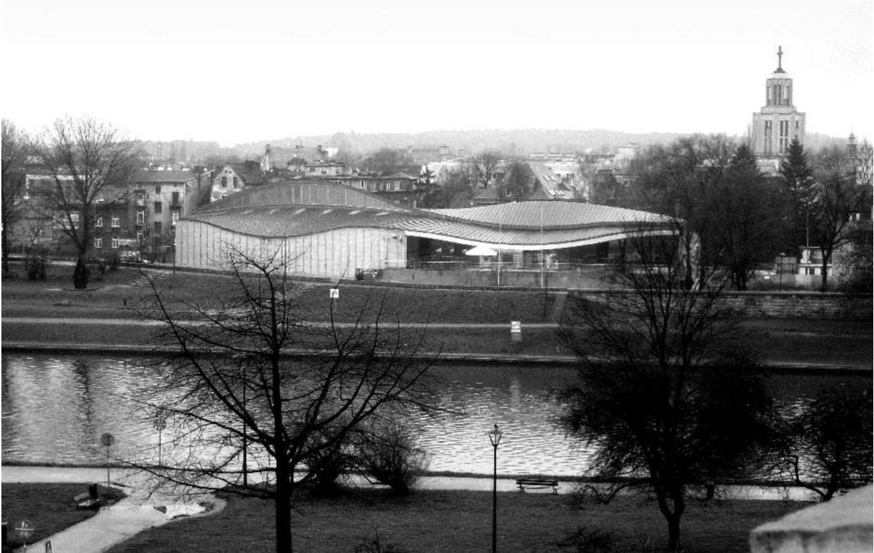
Рис. 4. Музей японського мистецтва і техніки Манггха у Кракові, Польща. Вигляд із тераси Вавельського замку.

розумінні стає інституцією динамічною та такою, що впроваджує нові поза музейні форми активності [8].