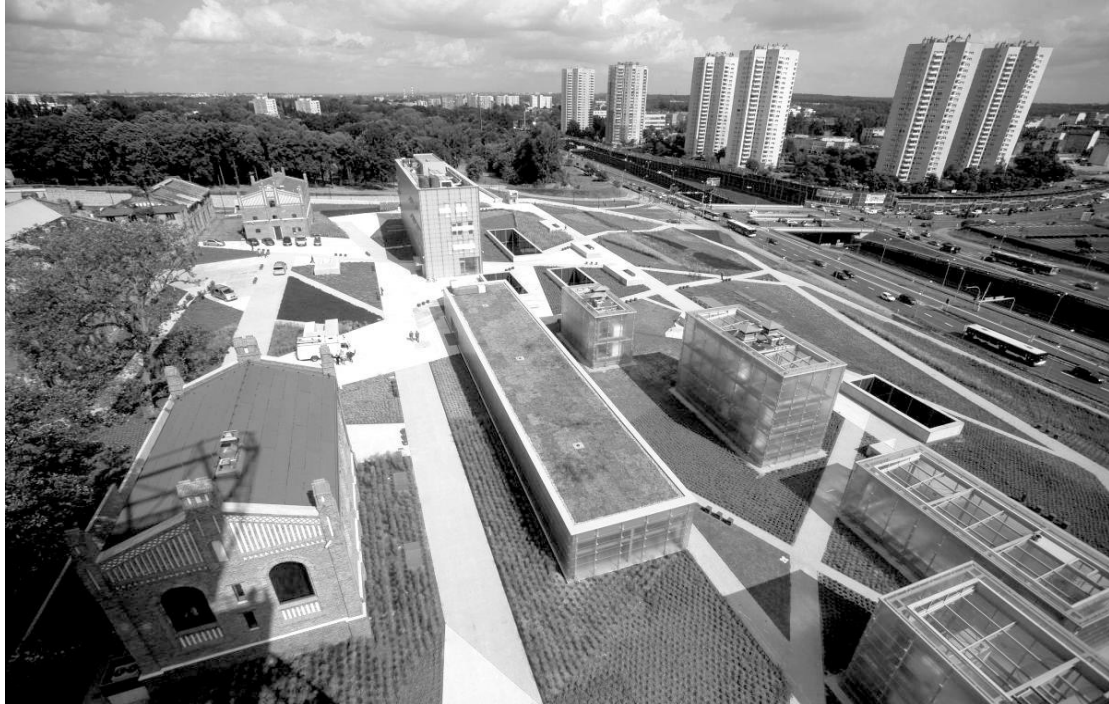
Рис. 5. Комплекс нових споруд Музею Сілезії у Катовіцах, Польща.

Комплекс нових споруд, що входять до складу вже існуючого Музею Сілезії (Muzeum Śląskie), розташований на території недіючої копальні кам'яного вугілля. Разом із іншими установами – Міжнародним Центром Конгресів (пол. Międzynarodowe Centrum Kongresowe) та новим будинком Національного симфонічного оркестру Польського радіо (пол. Narodowa Orkiestra Symfoniczna Polskiego Radia), – він творить так звану Зону Культури (Strefę Kultury) – новий центр культурного життя міста. Особливість даного музею є те, що більшість експозиції знаходиться на підземних рівнях, натомість пейзаж міста збагачується за рахунок надземних боксів із скляними фасадами, що у свою чергу забезпечує денне освітлення для підземних виставкових залів.