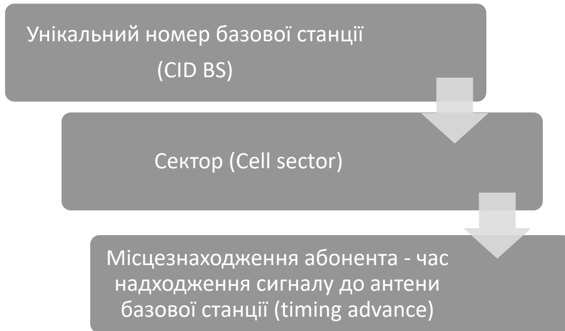
Рис.1. Схематичне покрокове відображення інформації щодо місцезнаходження абонента.