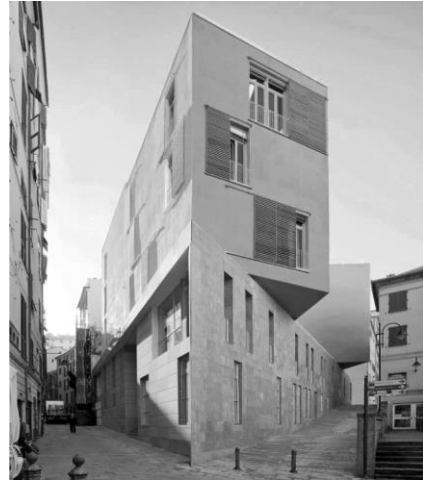
Рис. 6 Нова школа на Piazza Delle Erbe, м. Генуя (Італія). Проект проф. J. Friedrich, PFP architekten, 2014 р. [7].

Хоча навіть тут архітектори дотрималися лінії та напрямку забудови вулиці на рівні двох нижніх поверхів і суттєво не змінили панораму історичного ареалу міста.