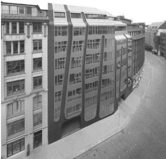
Рис. 7. S11 - Office Complex, м. Гамбург (Німеччина). Проект J. Mayer H. Architekten, 2009 р [7].

У Stadthaus Ballhausgasse / Broken mirror house (рис. 8) є подібність об'ємно-просторового вирішення фасаду, однакова