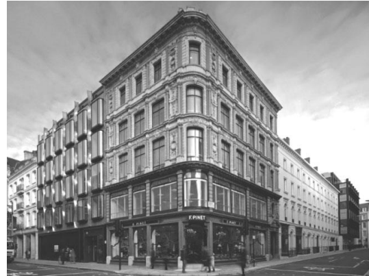
Рис. 10. Офісна споруда, м. Лондон (Англія). Проект Eric Parry Architects, 2011 р. [7]

6 будинків, присутній віддалений нюанс об'ємно-просторового вирішення (за винятком окремих складників, напр., обрисів даху) – у 5 будинках; нюансно взаємодіють поверховістю – 8, ритмом елементів та (або) членуванням фасадів – 11; характером деталей фасаду – 3, фактурами – 5, колірною гамою – 8 вставок.