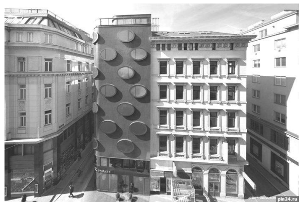
Рис. 2. Готель Torazz, м. Відень (Австрія). Проект BWM Architekten und Partner, 2012 р. [7].