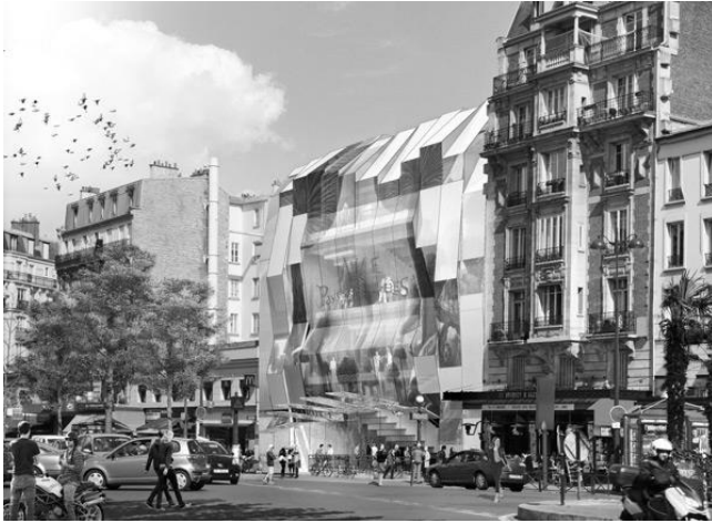
Рис. 5. Кінотеатр Gaumont-Pathé Alésia, м. Париж (Франція). Проект Manuelle Gautrand Architecture. Проект 2012 р. [7]. Збудована 2012-2016 рр. будівля дещо відрізняється від цього проекту.

Єдиним прикладом цієї групи, коли вставка стала найвизначнішим об'єктом історично сформованого середовища, що нагадує «нетрі» і естетику якого повторювати недоцільно, є школа на Piazza delle Erbe в Генуї (рис. 6).