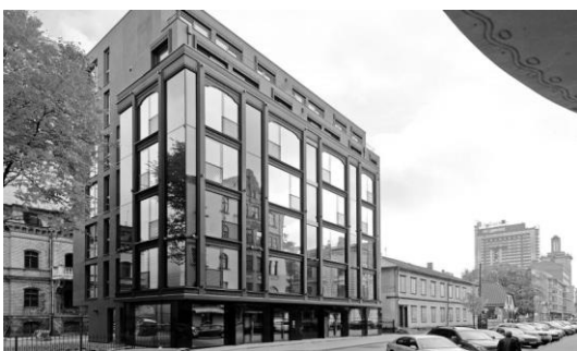
Рис. 3. Будинок з апартаментами “Club Central Residence”, м. Рига (Латвія). Проект SIA TECTUM и SIA Open arhitektūra un dizains, 2015 р. [7].