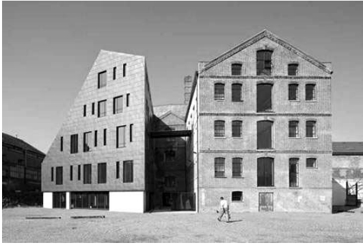
Рис. 9. The Granary, м. Лондон (Англія). Проект Pollard Thomas Edwards Architects, 2011 р. [7].