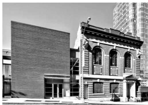
Рис. 4. Відпочинковий центр Gertrude Ederle, м. Нью-Йорк (США). Проект Belmont Freeman Architects, 2013 р. [7].

Кінотеатр Gaumont-Pathé Alésia (рис. 5) контрастує з прилеглою забудовою об'ємно-просторовим вирішенням, характером деталей фасаду, фактурами та