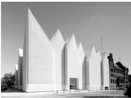
Рис. 1. Зал філармонії у м. Щецин (Польща). Проект Varozzi / Veiga, 2007-2014 р. [7].

Відпочинковий центр Gertrude Ederle (рис. 4) контрастує з сусідньою забудовою мінімальними членуваннями фасаду, відсутністю вікон та характером входу, гармоніює об'ємно-просторовим вирішенням, поверховістю, фактурою та колірною гамою фасаду.