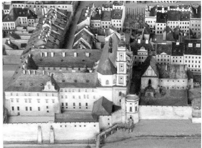
Рис. 2. Старе розпланування площі Ринок на Макеті Я. Вітвіцького 30-ті рр.. XX ст. [1].

Зі старих міських укріплень лише вдалось вціліти Пороховій вежі, яка стояла осторонь і далі служила як порохівниця, тобто складом зброї, залишкам Римарської вежі комплексу Домініканів та Малярської вежі, вежі цеху Токарів, Руської вежі, споруди Королівського та Міського арсеналів і східна частина високого муру. Зміни торкнулися також і головної водної артерії Львова – річки Полтви, що протікає із західного боку середмістя, де на першому етапі були споруджені три мости. На другому етапі почалось замурування ріки Полтви [7]. До 1840 року проіснував останній на сучасному проспекті Свободи міст навпроти нинішнього готелю «George». Аналізуючи архітектурні і містобудівні перевтілення у сформованому історичному ядрі як окремі послідовні та закономірні для свого часу явища можна виділити основні напрямки проектних робіт, які проводились наприкінці XIX ст. у Львові: