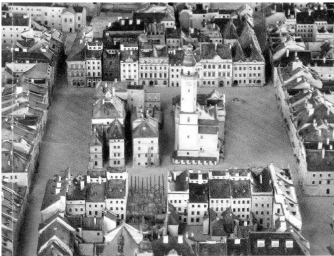
Рис. 3. План розпланування площі Ринок станом на поч. XX ст.

3- Власник за списками податків 1767 (ЦДІАЛ Ф-52 Оп-1 Сп-770; 777;783;812);