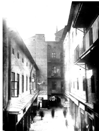
Рис. 4. Архівне фото пасажу Андреоллі 30-ті рр..

Важливий містобудівний документ був прийнятий міською владою у 1891 році, видана постанова про регулювання забудови у центральній частині міста [4]. Постанова була спрямована, у першу чергу, на покращення транспортного сполучення в кам'яницях, таким чином створити нові вулиці, які мали б набагато ширші параметри самої вуличної мережі. Основні реконструктивні роботи у середмісті передбачали наступні дії: