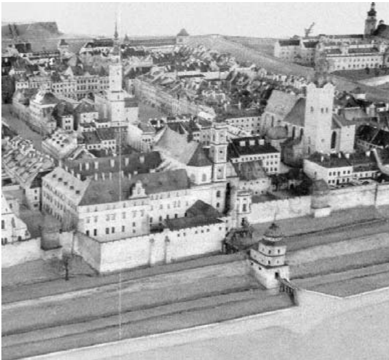
Рис. 1. Єзуїтська хвїртка на макеті Я. Вітвіцького 30-ті рр.. XX ст. [1].

кільцевих бульварів на їх місці, у Львові було проведено в період, з 1777 по 1835 рік. У Відні подібні заходи почали реалізовуватися лише, починаючи від 1857 р., у містах Будапешті та Празі після 1870 р.. Центр міста із площі Ринок поступово перемістився на новозакладене бульварне кільце, яке майже по всьому периметру охоплювало старе середньовічне місто, лише зі сходу оборонні мури простояли до середини XIX століття (початок демонтажних робіт припадає на 1820 рік).