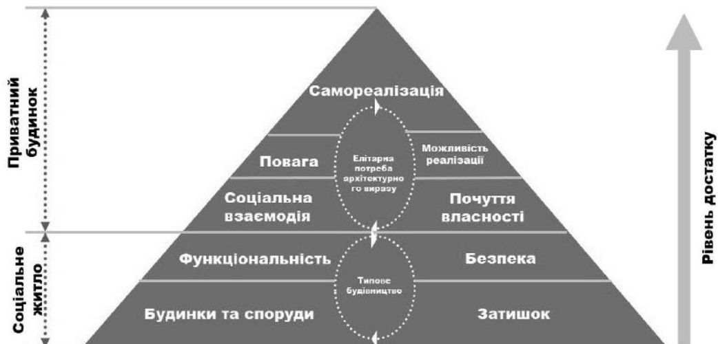
Рис. 2. Інтерпритована модель піраміди потреб людини А. Маслоу для приватного житла (розробка Joost van Hoof та Peter Boerenfijn)

Проте, для вирішення поставлених завдань дослідження ми використовуємо класичну модель потреб Маслоу. Дану гіпотезу підтверджують у своїх роботах Joost van Hoof та Peter Boerenfijn, які пропонують адаптовану піраміду потреб людини в контекст житлової архітектури [18] (рис. 2).