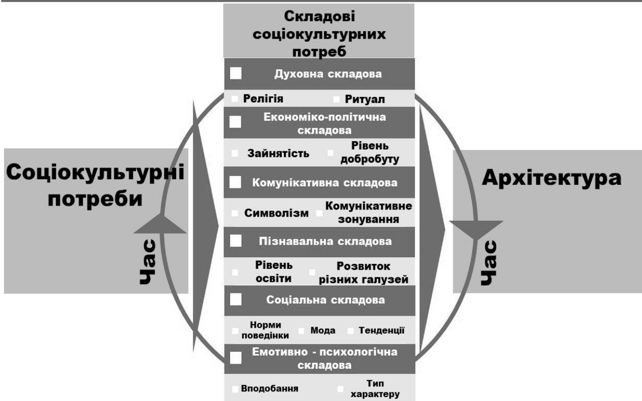
Рис. 5. Структура впливу соціокультури на архітектуру (розробка автора)

Духовна складова – духовна складова соціокультурних потреб людини є рушієм формування архітектурно-планувальних рішень протягом всього періоду життя людства. Ритуали людей, що пов’язані з релігійною складовою є чинником формування багатьох типологічних груп архітектури. Також вірування людей формують мають вплив на планувальні рішення житлових будинків (система планування будинку за принципом фен-шуй). В економіко-політичні складові формування архітектури входять рівень добробуту людей соціально-економічна ситуація в країні тощо. Рівень достатку людини формує систему купівельної спроможності, відповідно і попит на житло різного рівня комфортності (елітарне та соціальне житло). Також в сучасному суспільстві відбувається зміна сфер праці та поняття місця роботи. Активний розвиток віддаленої зайнятості формує потреби в робочих місцях, що сформовані безпосередньо в будинку або в недалеко від нього. В дану складову входить також науковий та технічний прогрес, який на нашу думку має безпосереднє відношення до економічної та політичної ситуації в країні. Ряд економіко-політичних чинників формує політику в сфері житлової архітектури.