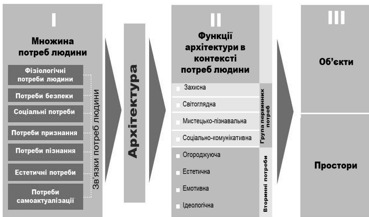
Рис. 3. Проекція впливу потреб людини для потреб архітектури (розробка автора)

Архітектурна зацікавленість соціокультурними потребами людей сучасності має на меті систематизувати інтереси окремих груп населення та виділити найбільш значущі зміни в контексті формування стратегій розвитку окремих територій, житлової політики населених пунктів, формування дієвої схеми функціональної, планувальної та об'ємно-просторової структури проектних рішень.