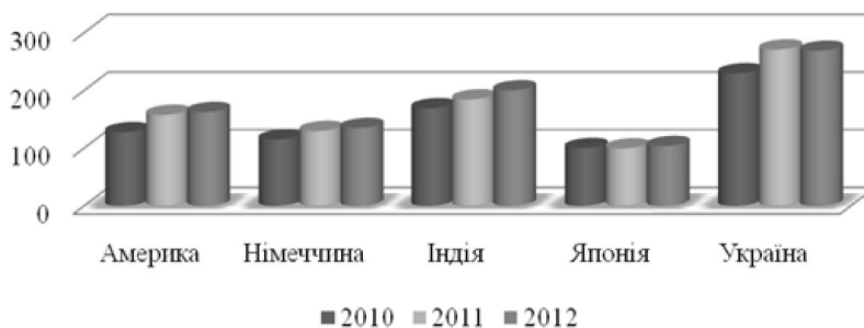
Рис. 2. Індекс цін виробників на агропродовольчу продукцію, 2010–2012 рр.

чий ринок функціонує на загальних принципах, таких як орієнтація на споживача, свобода вибору виробника, конкурентний та комплементарний характер взаємовідносин учасників, пріоритет приватних інтересів.