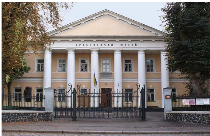
Рис. 2. Рівненський обласний краєзнавчий музей Fig. 2. Rivne regional museum of local history

Джерельною базою роботи слугували архівні матеріали фондів Рівненського краєзнавчого музею [Лист І. Свешнікова до В. Сидоренка, 25.10.1972 р.; Листування І. Свешнікова з Музеєм війська польського у Варшаві, 19.11.1973 р.], Наукового архіву відділу археології Інституту українознавства ім. І. Крип'якевича НАН України [Заява про виставку у м. Ванкувері “Козацькі скарби України”, папка № 44], а також опубліковане листування вченого зі