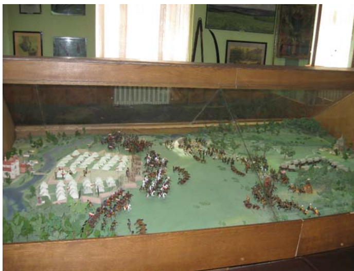
Рис. 6. Макет Берестецької битви у Рівненському краєзнавчому музеї, 1990 р.

За кордоном було відомо про досягнення археологічних експедицій під керівництвом І. Свешнікова на місці Берестецької битви, тому вибір для представлення цікавих експонатів українській діаспорі припав на козацькі знахідки. Таким чином, у серпні–вересні 1992 р. 120 унікальних речей з РОКМ та музею-заповідника “Козацькі могили” експонувались на виставці “Козацькі скарби з України”, що стала частиною загальної “Тихоокеанської національної виставки” у Ванкувері [НА відділу археології ІУ НАНУ, Заява про виставку..., папка № 44]. Її супровід та наукову підтримку здійснювали Ігор Свешніков, як відомий український дослідник козацької битви, та Гурій Бухало, як працівник РОКМ. За час роботи виставку відвідало близько 250 тис. осіб різних національностей.