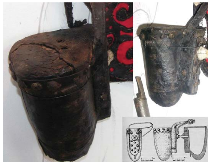
Рис. 5. Відреставрована порохівниця в експозиції музею “Козацькі могили”

Безпосередню участь керівник експедиції брав і в організації експозиції музеїв “Козацькі могили” та РОКМ. У 1972 р. на основі зібраного на той час археологічного матеріалу розпочалася перебудова експозиції музею-заповідника “Козацькі могили”. Маючи досвід музейної роботи, Ігор Свешніков активно долучився до цього процесу: радив щодо побудови експозиції, іноді після тривалого дня розкопок самотужки розкладав у вітринах відреставровані речі [Пономарьова, Булига, 2014, с. 55]. Дирекція музею постійно консультувалася з науковцем щодо робіт, які проводились в заповіднику: побудови діорами, перебудови експозиції. У листі до завідувача відділу музею-заповідника Павла Яковича Лотоцького археолог зазначав: