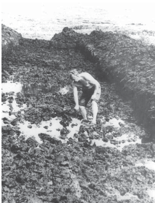
Рис. 3. Дослідник обстежує розкоп щупом, 1974 р.

Fig. 3. Researcher inspects excavation by the probe, 1974