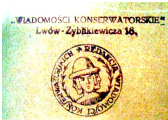
Рис. 9. Печатка редактора часопису “ Wiadomości Konserwatorskie ”

Аби забезпечити належне зберігання печі, консерватор ще кілька разів відвідував місцевість. Зрештою її законсервовано і відповідальність за збереження покладено на селищну владу та поліцію. Для музею Дідушицьких у Львові Б. Януш замовив виготовлення копії з дотриманням усіх розмірів і елементів.