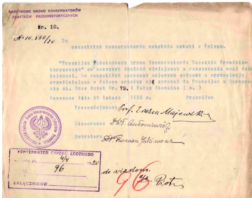
Рис. 2. Документ, що засвідчував початок роботи Президії Державного Грона консерваторів доісторичних пам'яток (Відділ рукописів ЛННБ ім. Стефаніка)

Всі ці роздуми на тему праісторії узагальнено в Меморіалі польської Akademii Umiejętności в Кракові від 12 червня 1919 р. і подано на розгляд до Міністерства віровизнань і народної освіти. Суть Меморіалу зводилася до трьох ключових пунктів: 1 – створення кафедр праісторії в кожному університеті і забезпечення їх всім необхідним (бібліотека, фотокопії археологічних експонатів з різних музеїв, копії знахідок); 2 – створення консерваторських органів, які йтимуть рука в руку з розвитком самих археологічних досліджень; створення семи округів з центрами у Кракові, Львові, Варшаві, Любліні, Познані, Торуні і Вільні, а при Міністерстві віровизнань і народної освіти створити окремий відділ, який відповідатиме за справи праісторії, і на чолі його стоятиме відомий професор з якогось з університетів (найкраще – Варшавського); 3 – у кожному воєводському центрі перевести існуючі музеї з праісторичними збірками у державну власність і їм поставити завдання збереження та експонування археологічних знахідок [O organizację..., 1920, s. 22].