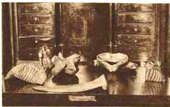
Рис. 8. Письмовий набір з кісток мамонта з Рудок Fig. 8. Writing utensils made of the mammoth's bones from Rudky

повинна надаватися консерваторам на їх службових округах. Поки що консерватор змушений з власної кишені покривати кошти подорожі і тільки тоді надсилати рахунок за неї” [Janusz, 1929, s. 256]. З огляду на саму територію Львівського округу, відсутність інших джерел фінансування для Б. Януша було суттєвою побутовою перешкодою на шляху до реалізації планів, бо нерідко просто не було грошей, щоб повноцінно виконувати роботу.