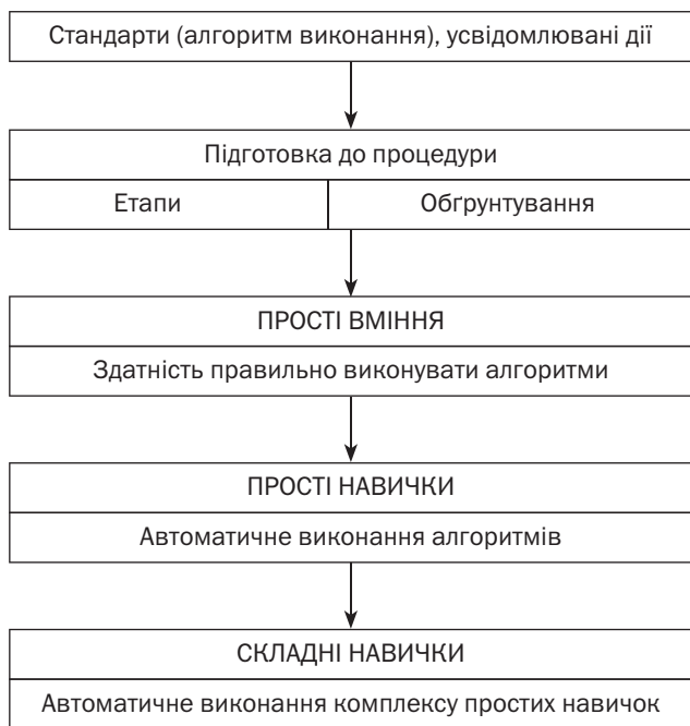
Рисунок 1. Етапи формування умінь

— підвищення та удосконалення професійно спрямованої уваги.