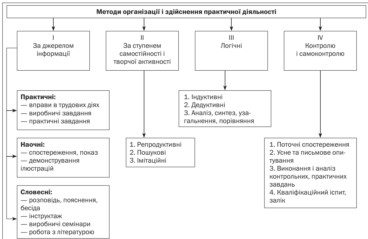
Рисунок 3. Класифікація методів практичного навчання

У міру повторення дії уміння виконувати її все більш відточується, вдосконалюється, а легкість і